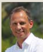
Ihr Thorsten Glauber Bayerischer Staatsminister für Umwelt und Verbraucherschutz

Nutzen Sie Ihre eigenen Handlungsoptionen. Seien Sie Teil einer breiten Klimaschutzbewegung. Vielen Dank!