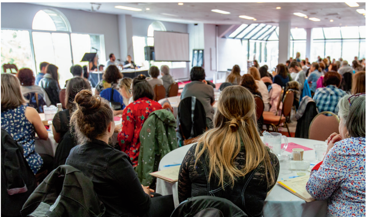
Im Rahmen eines moderierten Workshops kann wertvolles Wissen der Bevölkerung vor Ort gesammelt und in die Planung integriert werden.