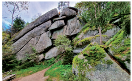
Nat. Geotop Felsenlabyrinth d. Luisenburg i. Wunsiedel

Mail: info@geopark-bayern.de Internet: www.geopark-bayern.de