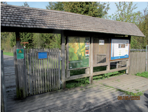
Geotop Schwarzes Moor

www.biosphaerenreservat-rhoen.de/fileadmin/media/publikationen/pdf/rhoener_geologie_erleben.pdf