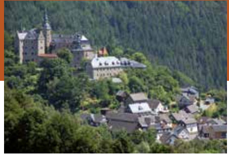
Blick auf Ludwigstadt mit Burg Lauenstein