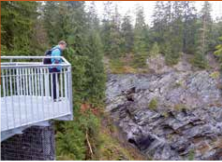
Schiefer im Schallersbruch