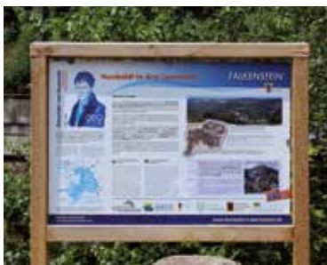
Schautafel GEO-Tour A. v. Humboldt

Das Projekt wurde mit Mitteln des Bayerischen Staatsministeriums für Umwelt und Verbraucherschutz gefördert.