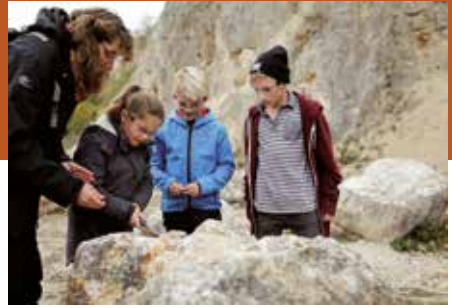
Führung im Erlebnis-Geotop Lindle