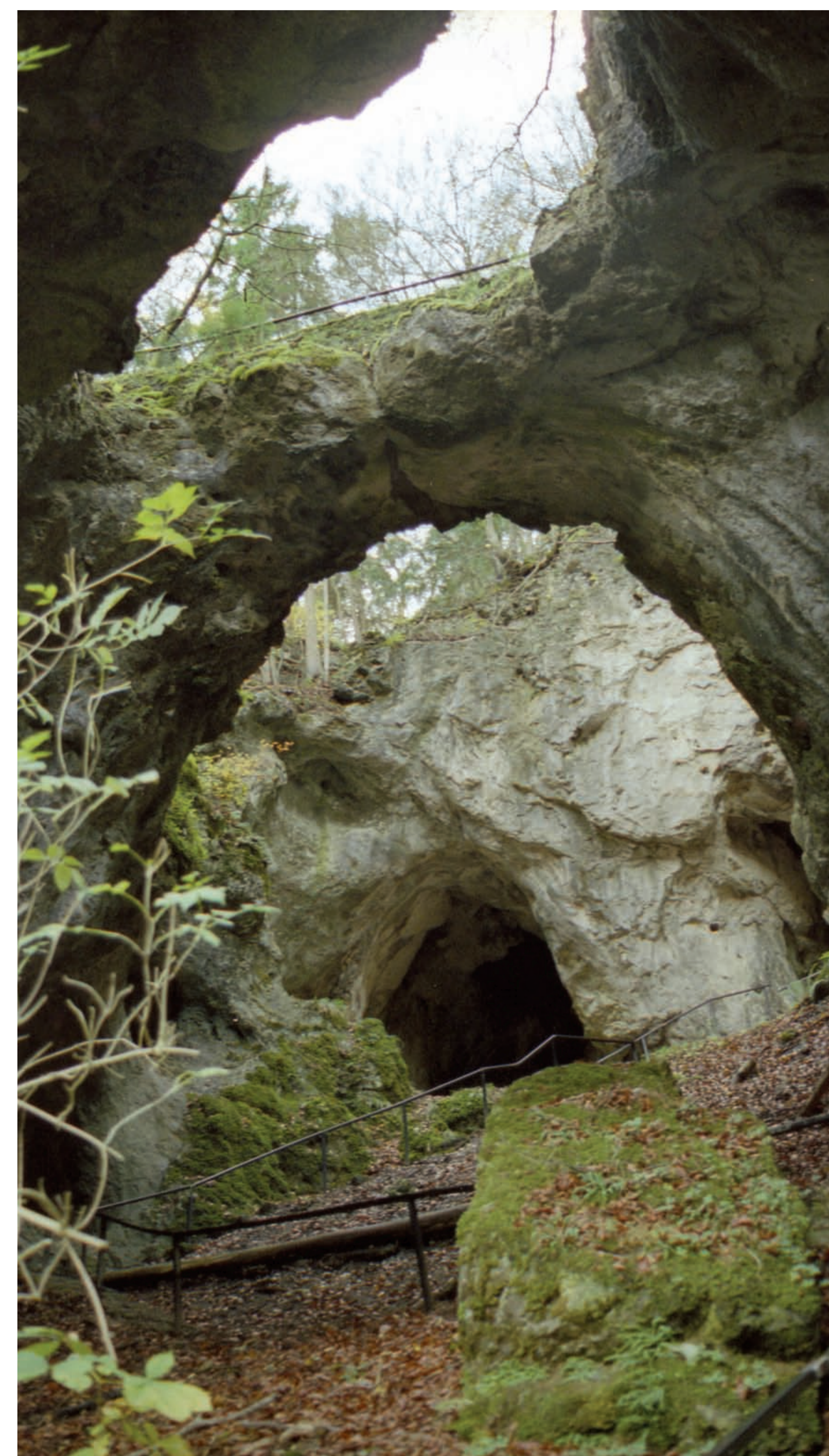
Die Höhlenruine Riesenburg ist als Naturdenkmal geschützt.

Hebungen der europäischen Kontinentalplatte gegen Ende des oberen Jura führten zu einem Rückzug des Meeres. Zu Beginn der folgenden Kreidezeit war das Gebiet der heutigen Frankenalb zunächst Festland. Während dieser Zeit herrschte tropisches Klima und es kam zu einer intensiven Verwitterung der vorher entstandenen Kalk- und Dolomitgesteine. Regenwasser nimmt CO 2 aus der Atmosphäre und beim Versickern aus dem Boden auf. Entlang von Trennflächen im Gestein, so genannten Klüften, kann dieses Kohlensäure-haltige Wasser in den Gesteinsverband eindringen. Die leichte Säure vermag Kalk bzw. Dolomit zu lösen und bewirkt im Lauf der Zeit die Bildung von Hohlräumen im Gestein. Durch diese „Verkarstung“ entstehen im Untergrund Hohlräume, die schließlich das Gebiet komplett unterirdisch entwässern. Zur Zeit der Oberkreide stieß erneut ein Meer in den Bereich der Frankenalb vor. Die darin liegenden Karsthöhlen wurden meist mit Sedimenten verfüllt. In der Tertiär-Zeit erfolgte durch regionale Hebung ein erneuter Meeresspiegelrückgang sowie eine teilweise Freilegung der Juralandschaft.