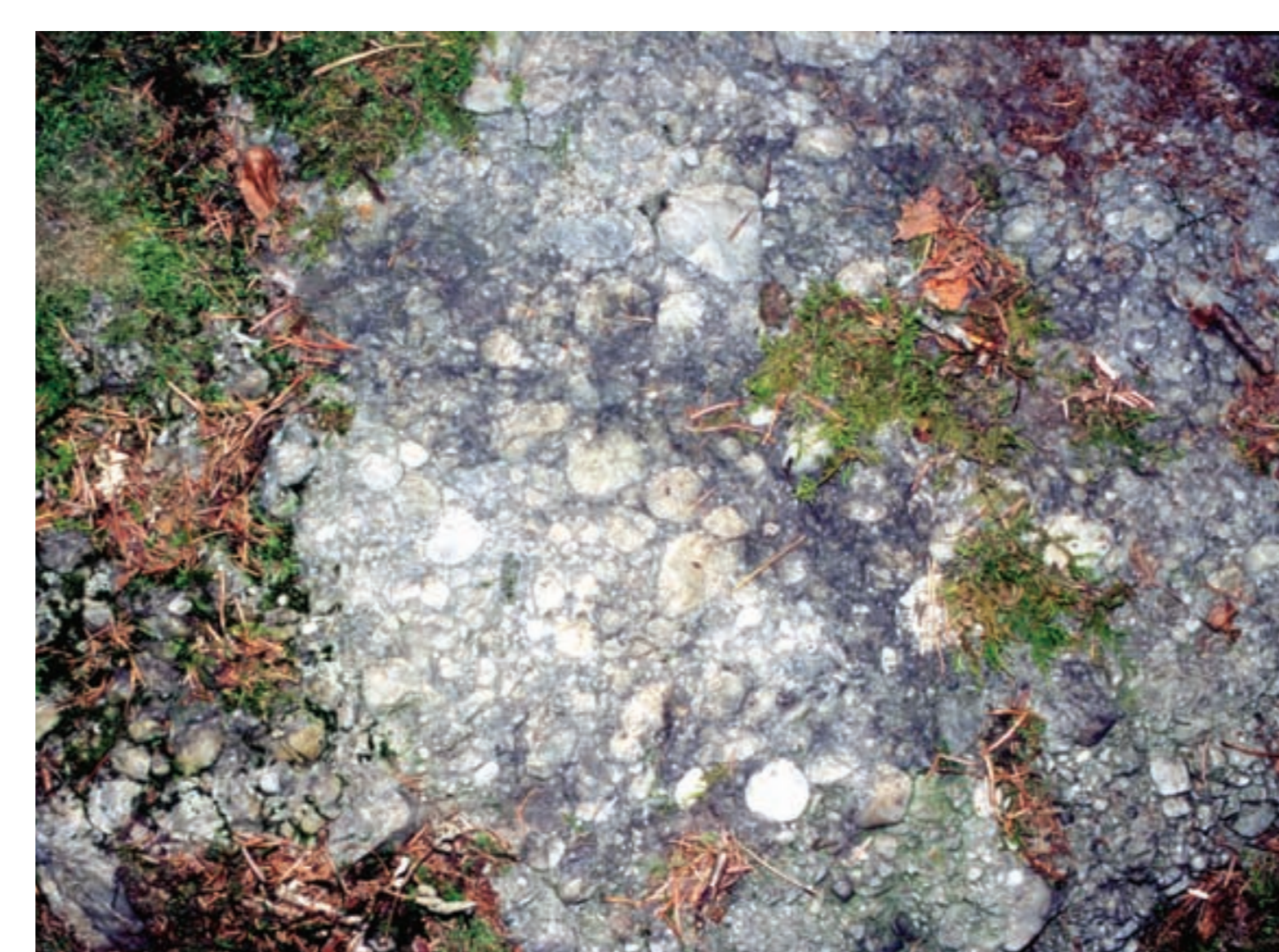
Quarzgerölle und Quarzsand sind durch kieseliges (= „quarziges“) Bindemittel zu einem harten Gestein verkittet.

fast alle Gerölle chemisch zersetzt und aufgelöst. Feldspatminerale wurden zum Tonmineral Kaolinit umgewandelt. Als diese Verwitterungsphase zu Ende ging, blieb eine Gesteinseinheit zurück, die hauptsächlich aus in Quarzsand und Kaolinit eingebetteten Quarzgeröllen besteht – der Quarzrestschotter. Stellenweise ist nahe der damaligen Landoberfläche und als heutige Deckschicht der Quarzrestschotter eine ein bis vier Meter mächtige Konglomeratbank ausgebildet. Sie entstand bei der Verwitterung der silikatischen Bestandteile, als Kieselsäure (SiO 2 ) freigesetzt, im Grundwasser gelöst und unter bestimmten chemischen Bedingungen wieder ausgefällt wurde. Die losen Quarzgerölle wurden durch dieses kieselige Bindemittel fest miteinander verbunden. Aus dem Quarzrestschotter war das harte und verwitterungsbeständige Quarzkonglomerat geworden. Als steile Geländestufen am Hang, als Unterlage von Verebnungsflächen und in Form von zahlreichen Einzelblöcken ist es im südöstlichen Niederbayern ein landschaftsprägendes Element.