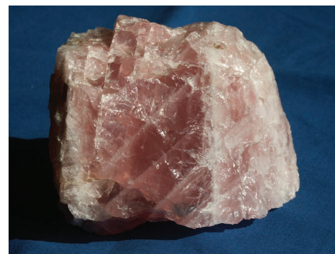
Rosenquarz (ca. 10 cm)

Die ehemaligen Lagerstätten Hagendorf-Nord und Hagendorf-Süd hingegen waren vollständig dokumentiert, wurden aber in der Vergangenheit weitgehend abgebaut. In Hagendorf-Süd gewann man überwiegend Feldspat für die keramische Industrie sowie Phosphatminerale - allen voran das Lithiumphosphat Triphylin.