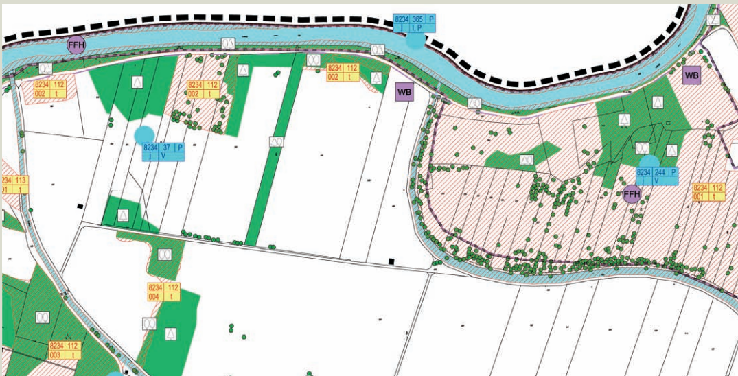
Abb. 26 Ausschnitt aus einer Themenkarte Arten und Lebensräume, Schutzgebiete: kartierte Biotope (rot), Angaben zum ABSP (blau), Wiesenbrüterflächen, Natura 2000-Gebiete (lila).