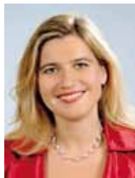
Melanie Huml MdL Staatssekretärin im Bayerischen Staatsministerium für Umwelt und Gesundheit