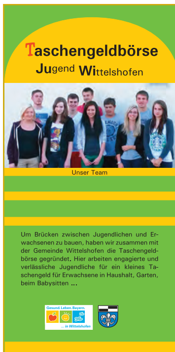
Abbildung 1: Ein Flyer informiert über das Angebot der Taschengeldbörse

Vor dem Hintergrund des demografischen und epidemiologischen Wandels mit zunehmend älterer Bevölkerung und der erwarteten Änderung im Ranking und der Häufigkeit der Zivilisationskrankheiten müssen neue Konzepte gefunden werden, um diese Entwicklung zumindest abzumildern.