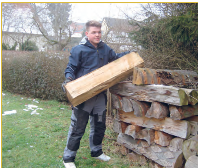
Abbildung 7: Voneinander lernen: Im Rahmen der Taschengeldbörse werden auch traditionelle Fertigkeiten und Techniken weitergegeben wie hier das Stapeln von Holz

Die Taschengeldbörse sorgt dafür, dass die Jugendlichen zusätzliche Fertigkeiten und soziale Kompetenzen (Vorplanung, Terminorganisation, Pünktlichkeit, Höflichkeit, Interaktionsfähigkeit) außerhalb der Schule erlernen und weiter entwickeln.