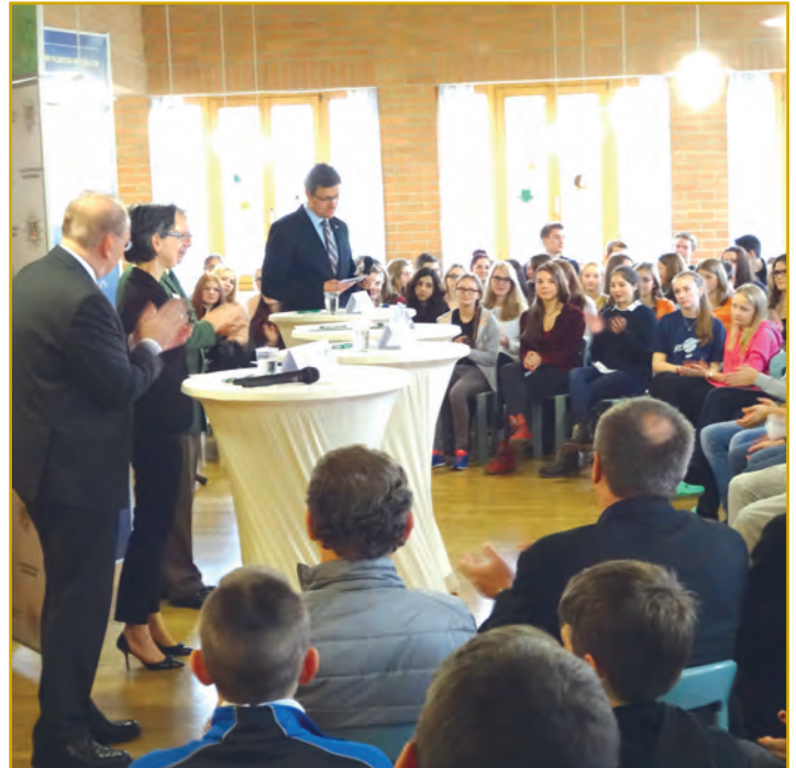
Abbildung 2: Start in die gemeinsame Woche mit einer Podiumsdiskussion