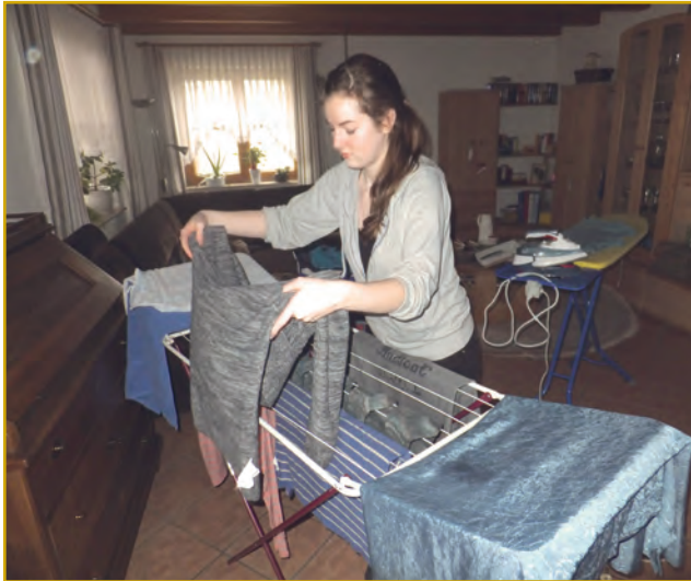
Abbildung 6: Hilfe im Haushalt

Es hat sich auch gezeigt, dass durch die Zusammenarbeit zwischen Auftraggeber und Jugendlichen auch Fertigkeiten und Handwerkstechniken weitergegeben werden (Stapeln von Holzstößen, Baumschneidetechniken, Mieten anlegen, Gardinen stärken usw.).