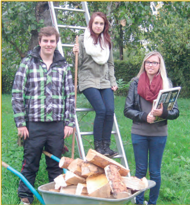
Abbildung 2: Die Jugendlichen organisieren ihre Einsätze für die Taschengeldbörse über Social Media-Nachrichtendienste

Die Prävention wird zunehmend an Bedeutung gewinnen, so dass es höchste Zeit ist, Konzepte zur Stärkung der Eigenkompetenz zur Erhaltung und Verbesserung der eigenen Gesundheit nicht nur theoretisch zu entwickeln, sondern mit aller Kraft und Leidenschaft umzusetzen.