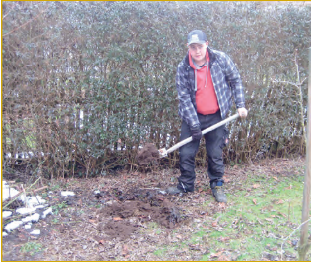
Abbildung 4: Unterstützung bei der Gartenarbeit

Der Arbeitsauftrag wird von einem der Erwachsenen (telefonisch oder persönlich) entgegengenommen, auch um die Seriosität des Auftrages und Auftraggebers gegebenenfalls überprüfen zu können. Wenn die gewünschten Tätigkeiten übernommen werden können, wird der Auftrag an den „leitenden“ Jugendlichen (telefonisch) übermittelt. Die Jugendlichen stimmen sich unter Einsatz von Social Media (What's App / Smartphone) untereinander ab und klären, wer den Auftrag übernimmt. Derjenige oder diejenigen stimmen sich dann telefonisch mit dem Auftraggeber über Zeitpunkt und Umfang ab.