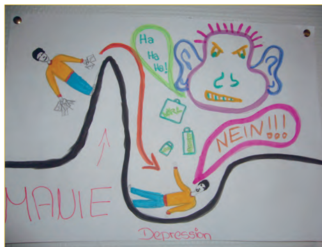
Abbildung 1: Kinderzeichnung „Das bipolare Monster“, entstanden im Rahmen der Kindersprechstunde am Bezirkskrankenhaus Augsburg

So leiden die Kinder zunächst unter den verunsichernden und verwirrenden familiären Veränderungen, die eine psychische Erkrankung mit sich bringt. Sie fühlen sich alleingelassen, weniger wahrgenommen und müssen mit einem Defizit an Aufmerksamkeit, Zuwendung und Versorgung zurechtkommen. Angst und Hilflosigkeit macht sich breit, wenn ein Kind merkt, dass die Mutter oder der Vater nicht mehr so fröhlich, leistungsfähig oder ansprechbar wie früher ist.