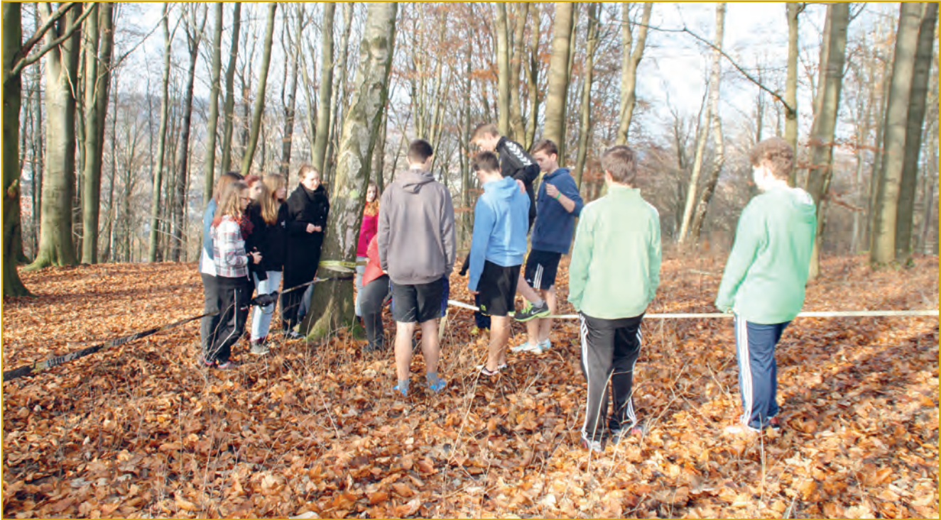
Abbildung 4: Teamfähigkeit, Vertrauen und Gemeinschaft stehen im Mittelpunkt der erlebnispädagogischen Angebote