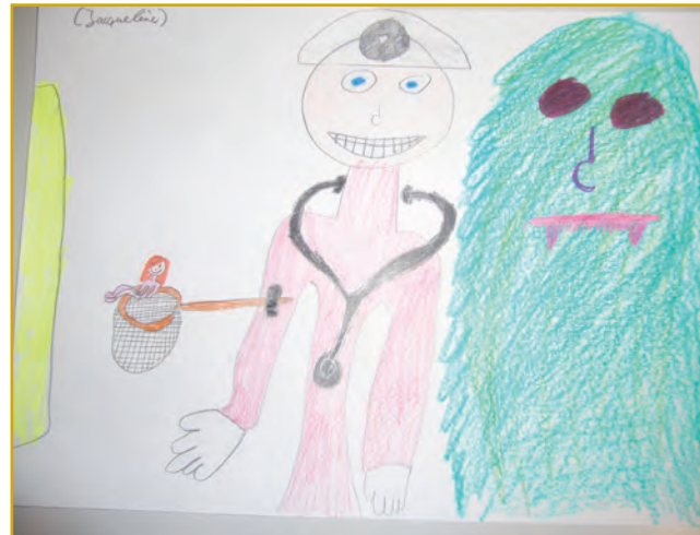
Abbildung 4: „Wie der Arzt meine Mama vom Monster befreit“