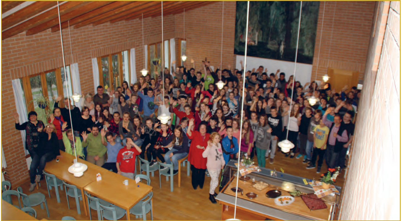
Abbildung 3: Rund 120 Mädchen und Jungen aus zwei tschechischen und drei bayerischen Schulen waren mit großem Interesse und viel Spaß bei der Präventionswoche dabei