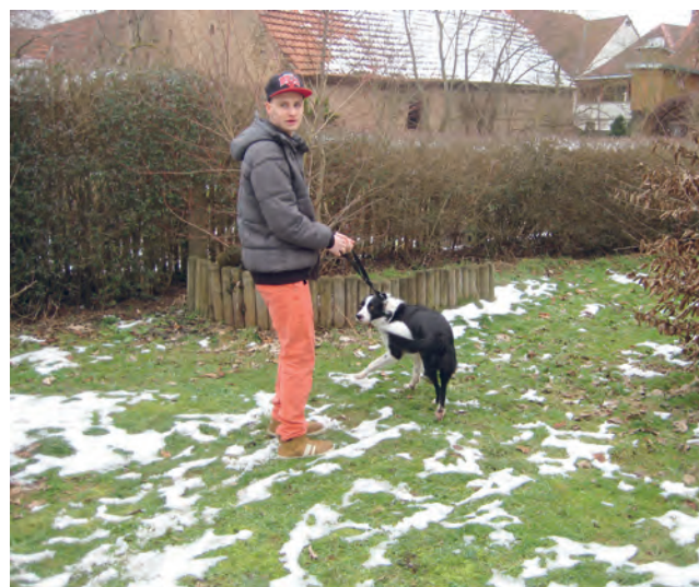
Abbildung 3: Alltagsnahe Hilfen in Haus, Garten und bei der Versorgung von Tieren

Die Jugendlichen der Taschengeldbörse organisieren sich vorwiegend eigenständig. Sie werden dabei ehrenamtlich von zwei Erwachsenen unterstützt, die die Organisation im Umfeld der Taschengeldbörse übernehmen.