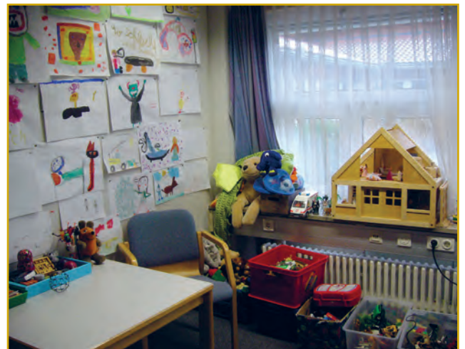
Abbildung 2: Raum der Kindersprechstunde im BKH Augsburg

Die Kindersprechstunde findet in einem eigens dafür eingerichteten „Spielzimmer“ im Bezirkskrankenhaus Augsburg statt.