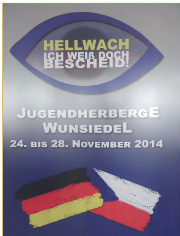
Abbildung 1: Das Konzept für die länderübergreifende Präventionswoche entwickelten die Jugendherberge Wunsiedel, Polizei und Suchtarbeitskreis Hof sowie der Fachbereich Gesundheitswesen am Landratsamt Wunsiedel gemeinsam. Die Schirmherrschaft übernahm Staatsminister Joachim Herrmann (Bayerisches Staatsministerium des Innern).

Unser Konzept richtet sich an Jugendliche im Einstiegsalter, vorwiegend im 8. und 9. Schuljahr. Es unterstützt Lehrerinnen und Lehrer aller Schularten in der suchtpräventiven Arbeit, unabhängig von Stundenplan und Zeitdruck, kompetent, stressfrei und mit jugendgerechter Begleitung.