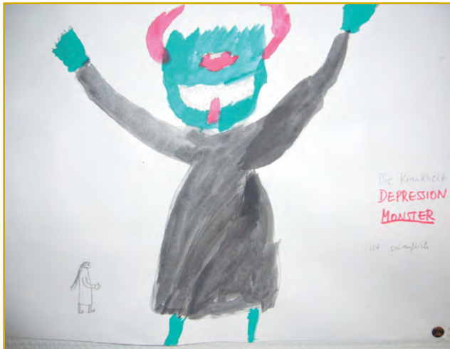
Abbildung 3: „Das bipolare Monster“