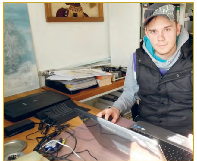
Abbildung 5: Zunehmend nachgefragt wird Unterstützung beim Umgang mit elektronischen Geräten

Eine Haftung für Sachschäden für Arbeiten, die über die Taschengeldbörse vermittelt werden, kann von der Gemeinde nicht übernommen werden. Die Gemeinde Wittelshofen unterstützt die Taschengeldbörse ausschließlich ideell.