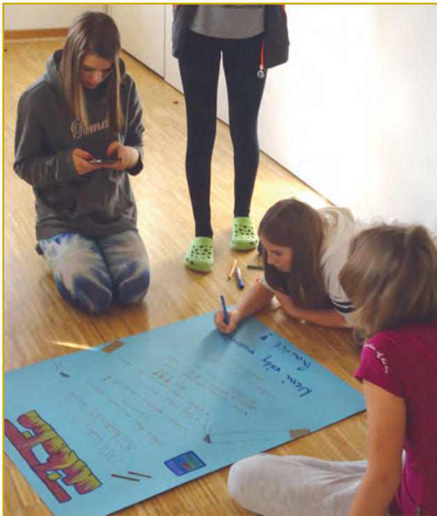
Abbildung 5: In Teamarbeit werden die Themen der suchtpreventiven Workshops vertieft