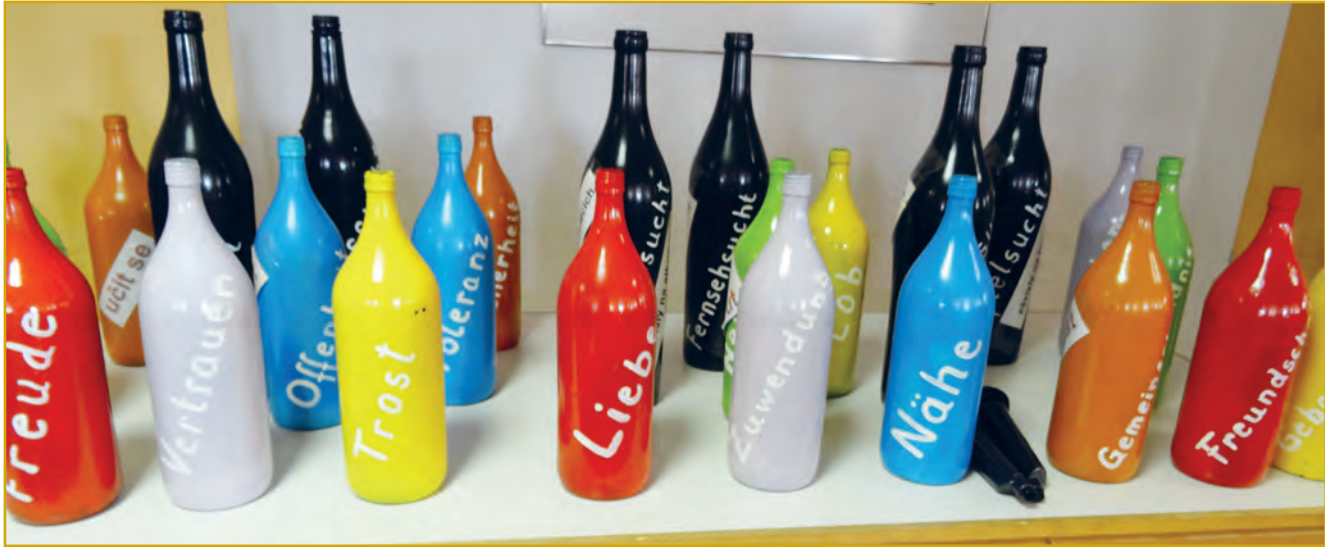
Abbildung 6: Vertrauen, Liebe, Freundschaft, Zuwendung, Offenheit, Nähe: Ressourcen für ein Leben ohne Sucht