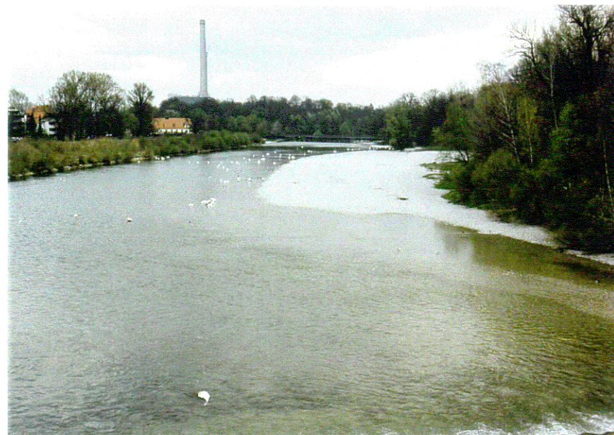
rd. 13 m 3 /s