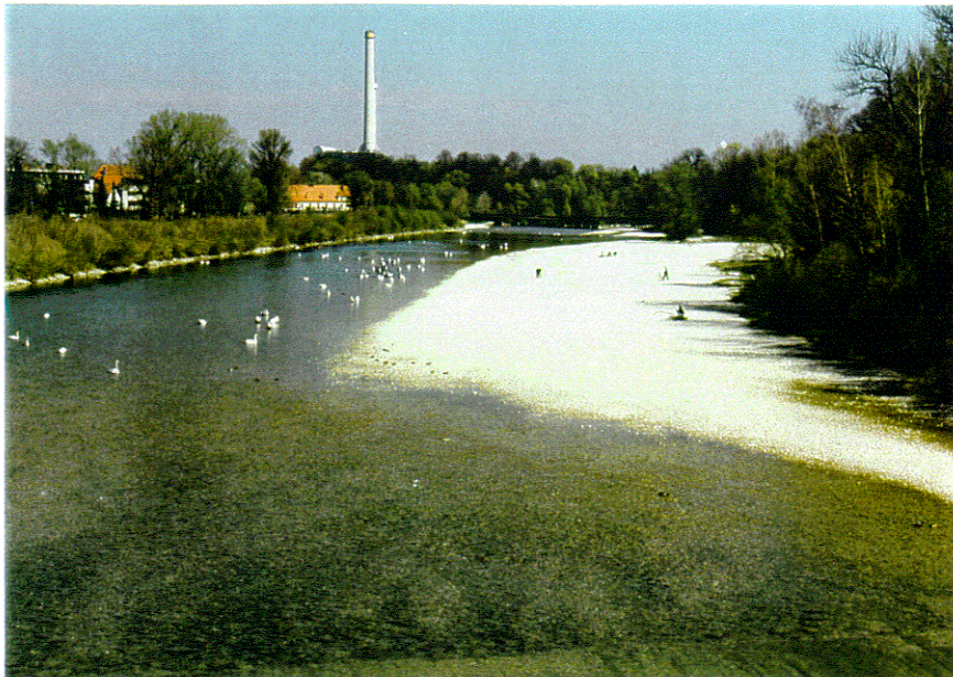
rd. 6,5 m 3 /s