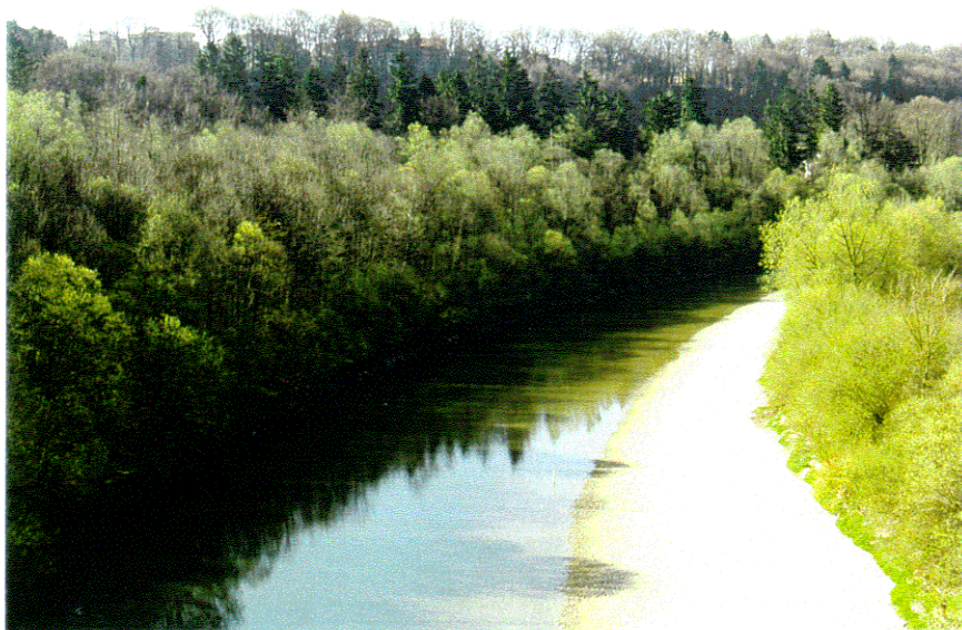
rd. 6,5 m 3 /s