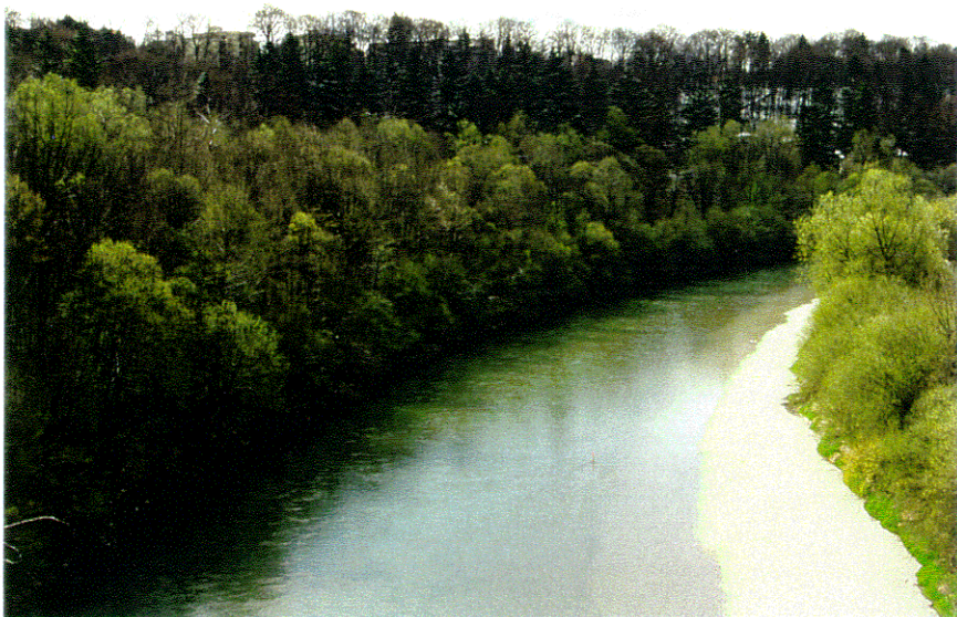
rd. 17 m 3 /s