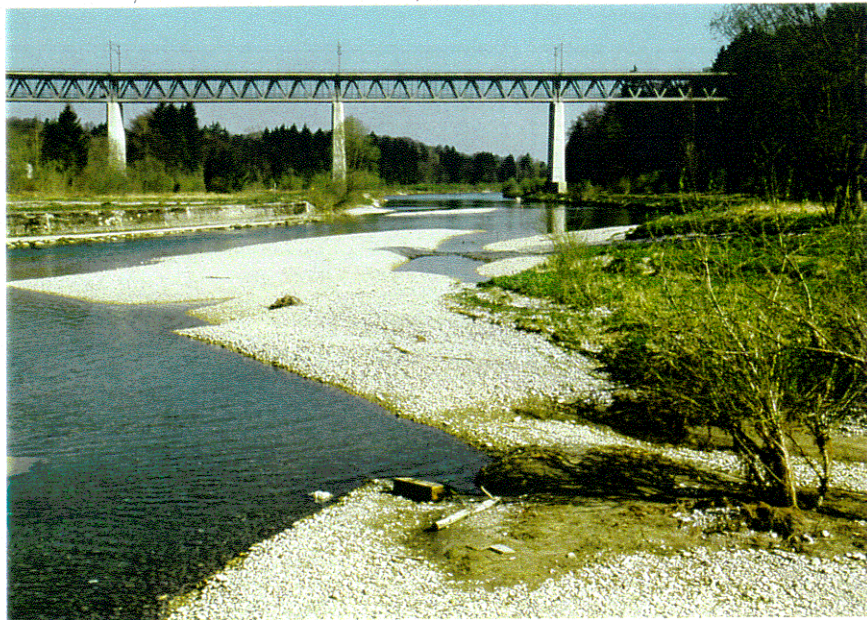
rd. 6.5 m 3 /s