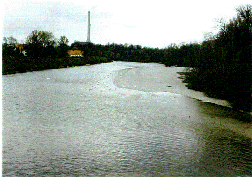
rd. 17 m 3 /s