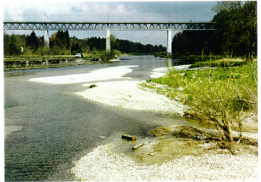
rd. 13 m 3 /s