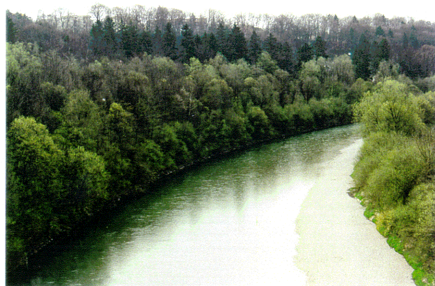
rd. 13 m 3 /s