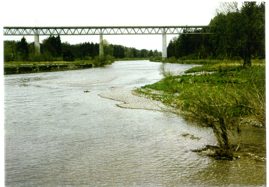
rd. 27 m 3 /s