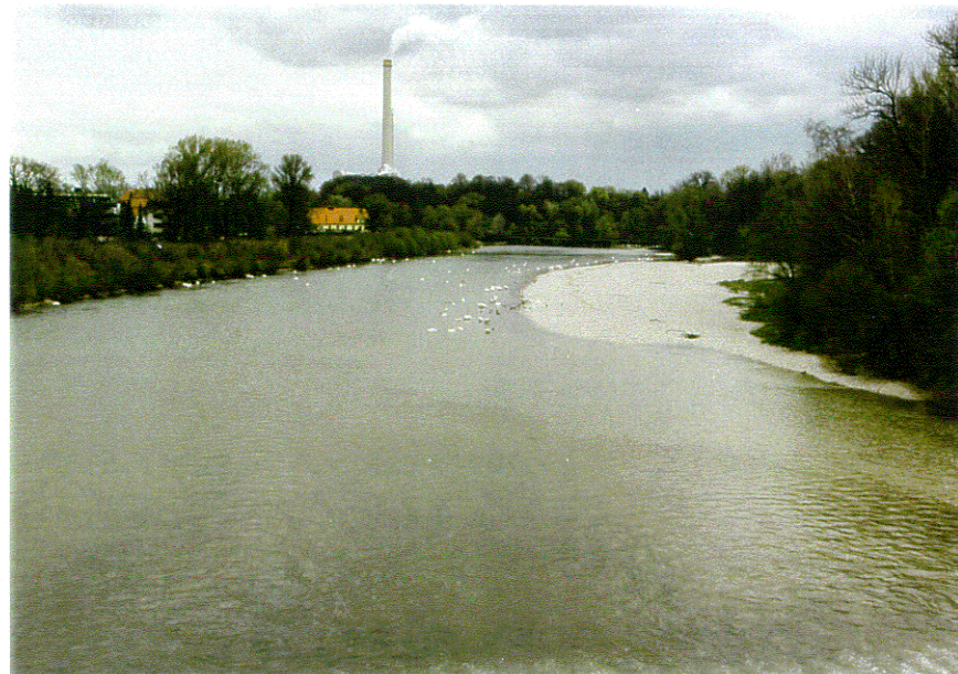
rd. 27 m 3 /s