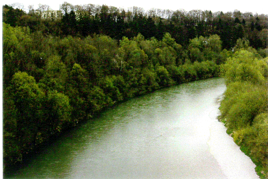
rd. 27 m 3 /s