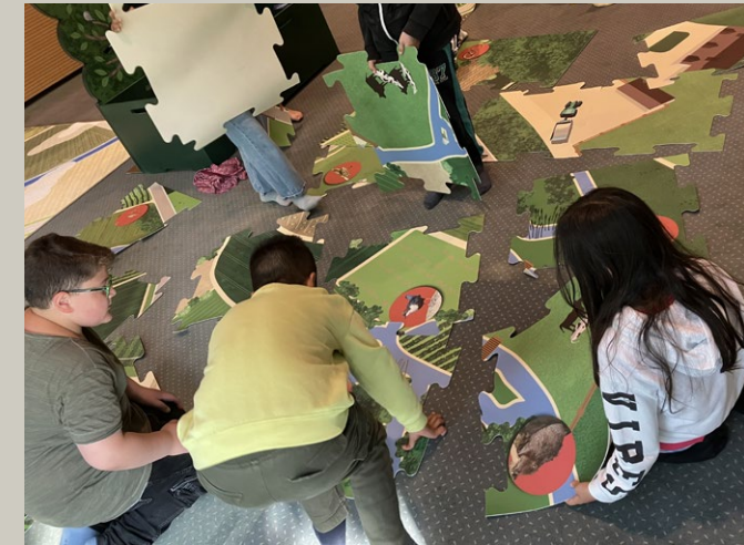
Beim Bodenpuzzle wird der Fluss in die Landschaft eingebettet