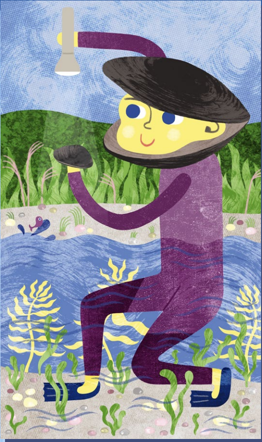
Botschafter-Figuren führen die Kinder durch die Ausstellung