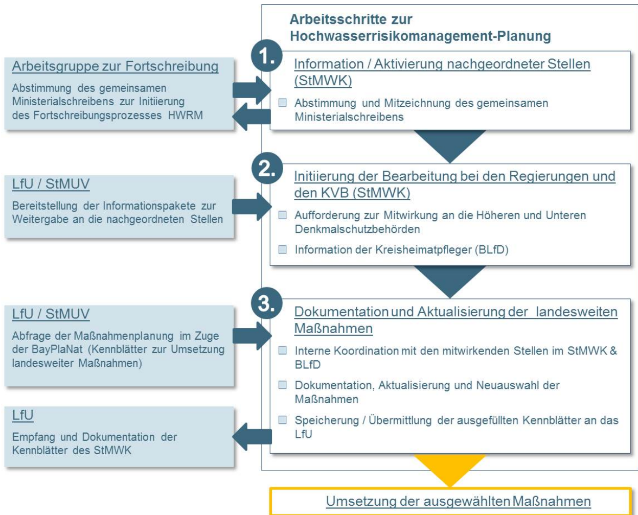
Abb. 1: Ablaufübersicht/Checkliste für das StMWK & BLfD zur Hochwasserrisikomanagement-Planung

Das StMWK wirkt am Gesamtprozess der HWRM-Planung in Bayern in drei Schritten mit (siehe Abbildung 1).