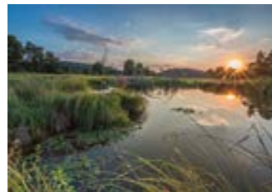
April Deusmauer Moor (Neumarkt in der Oberpfalz) „Sonnenuntergang im Deusmauer Moor“