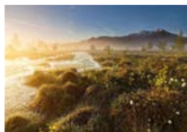
Juli Kendlmühlfilze (Traunstein) Foto: Florian Knülle | Platz 1 „Das Moor erwacht zu neuem Leben“