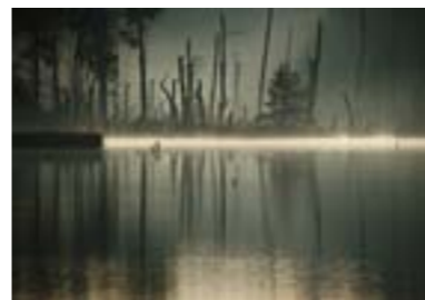
Dezember Schönramer Filz (Traunstein | Berchtesgadener Land) „Morgenerwachen im Moor“