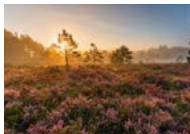
September Rothenrainer Moor (Bad Tölz-Wolfratshausen) „Heideglühen im Morgenlicht“