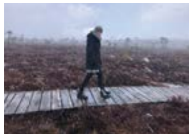
Januar Schwarzes Moor (Rhön-Grabfeld) „Schneegestöber im April“