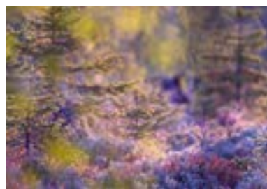
Mai Haspelmoor (Fürstenfeldbruck) „Gesponnenes Licht“