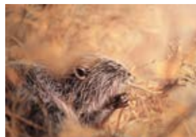
Oktober Ettaler Weidmoos (Garmisch-Partenkirchen) „Harmonisches Abendessen im letzten Sonnenstrahl“