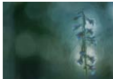
März Inzeller Filz (Traunstein) „Sumpfstendelwurz im ersten Tageslicht“