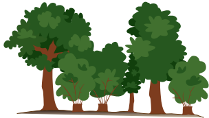
Mittelwälder vereinen Stockausschläge im Unterholz mit Kernwüchsen im Oberholz.