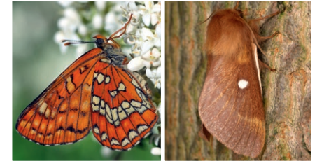
links: Maivogel; rechts: Heckenwollflatter

Von der regelmäßigen Auflichtung und der infolgedessen reichen Bodenvegetation profitieren auch licht- und wärmeliebende Tiere wie die beiden Falterarten Heckenwollflatter und Maivogel. Einst weit verbreitet, sind sie heute vom Aussterben bedroht, da ihre Lebensräume schrumpfen. So wird ihr Rückgang mitunter auf die Aufgabe der Mittelwaldwirtschaft zurückgeführt.