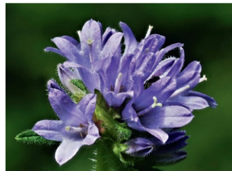
links: Borstige Glockenblume; rechts: Diptam

Direkt nach der Holzernte wirken Mittel- und Niederwälder oft etwas kahl. Was zunächst nicht so ansprechend aussieht, wird schnell zum Gewinn für die Artenvielfalt. Denn nach einem Hieb dringt wieder sehr viel Licht auf den Waldboden und lässt Pflanzen aus im Boden schlummern Samen, Wurzeln, Knollen etc. sprießen. Sie können wieder für einige Jahre kräftig blühen, bevor die Bäume sie erneut verschatten.