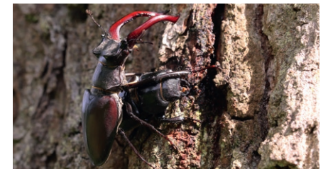
Mit bis zu neun Zentimetern Länge ist der Hirschkäfer eine der größten heimischen Käfer- arten.

In den Tiefen der abgestorbenen Wurzelstöcke alter Laubbäume wiederum entwickeln sich die Larven des in Bayern stark gefährdeten Hirschkäfers. Er benötigt ausreichend zersetztes Holz mit Bodenkontakt und lichte, wärmebegünstigte Waldstrukturen.