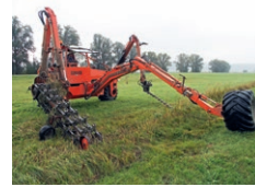
Angepasste Mahd eines kleinen Bachlaufs – lebenswichtig für die Helm-Azurjungfer