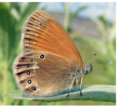
Eine Insel inmitten intensiv genutzter Agrarlandschaft – noch fliegt hier das Rotbraune Wiesenvögelchen, ein kleiner, stark gefährdeter Schmetterling.

Unsere Landschaft befindet sich in ständigem Wandel. Die Notwendigkeit, Natur und Landschaft für uns und für künftige Generationen zu erhalten, muss gegenüber anderweitigen Ansprüchen abgewogen werden. So beansprucht die Land-, Forst- und Fischereiwirtschaft, der Straßen-, Gewerbe- und Wohnungsbau oder auch die Rohstoff- und Energiegewinnung sowie unsere Freizeitgestaltung potentiell wertvolle Naturflächen.