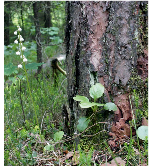
In den Alpen können Schneeheide-Kiefernwälder ein geeigneter Wuchsort für das Mittlere Wintergrün sein.

Das Mittlere Wintergrün ist weder europarechtlich geschützt, noch in der Bundesartenschutzverordnung aufgeführt. Es unterliegt demnach in Bayern keinem besonderen gesetzlichen Schutz.