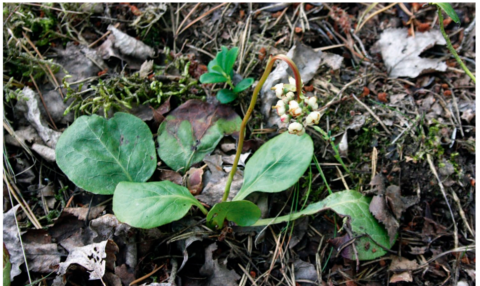
Ein durch Trockenstress nach zu starker Gehölzreduktion geschädigter Trieb von Pyrola media.

steril bleiben und konkurrierende Moose begünstigt werden, die die geschwächten Wintergrün-Pflanzen überwuchern.