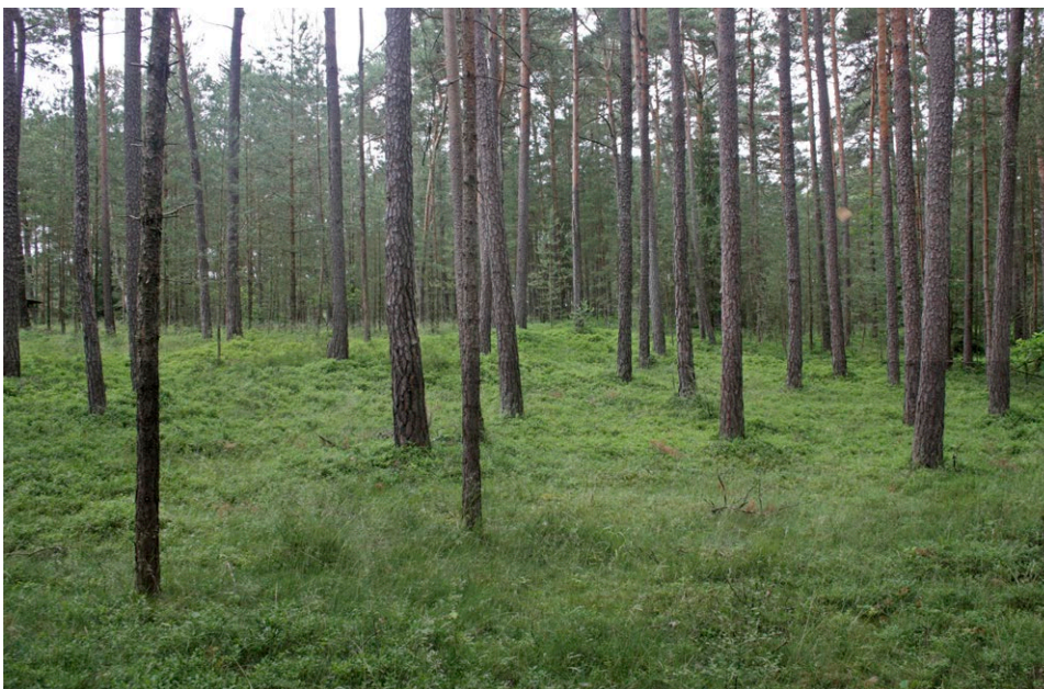
In diesem nährstoffarmen, lichten Kiefernforst bei Sengenthal wächst ein stabiles Vorkommen von Pyrola media.

Die Ausgangssubstrate der Art sind vielfältig. In den Mittelgebirgen besiedelt die Art überwiegend sauer verwitternde Böden des Keupers und der Grundgebirge. Im Alpen und Voralpenraum werden Dolomit-Gesteine bevorzugt, allerdings unter sauren, modrig-humosen Bodenbedingungen.