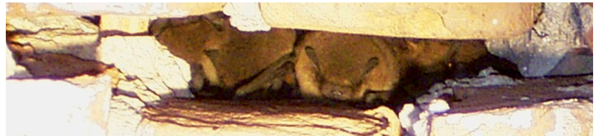
Quartier der Zwergfledermaus in einer Mauerspalte

Schirmherr der Aktion ist das bayerische Umweltministerium.