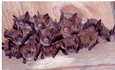
Kolonie der Winterfledermaus in einem Dachboden

Unterkünfte und Quartiersmöglichkeiten für Fledermäuse müssen daher bewusst geschützt und neu geschaffen werden.