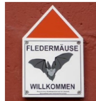
Engagement sichtbar machen – Die Plakette zeigt: hier gibt es Fledermausquartiere

Nehmen Sie teil und zeigen Sie Ihr Engagement für Fledermäuse mit der Plakette „Fledermäuse willkommen“.