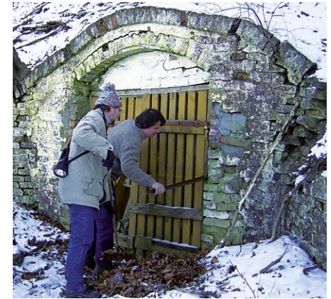
Kontrolle eines Winterquartiers in einem alten Bierkeller