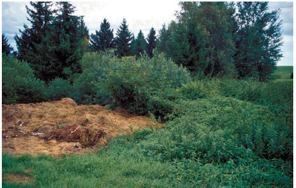
Durch Ablagerungen stark beeinträchtigter Lebensraum des Blauschillernden Feuerfalters – der Wert aufgelassener Torfstiche wird leider oft nicht erkannt (Bernbeuren).

Der Blauschillernde Feuerfalter besiedelt heute überwiegend Sekundärbiotopie die durch Pflegemaßnahmen offen gehalten werden müssen. Dabei ist der Erhalt von Gehölzen als Windschutz sowie