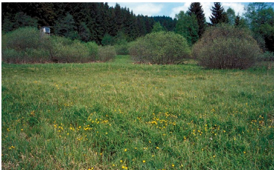
Niedermoor mit Nasswiesen, Brachflächen und Weidengebüschen – ein typisches Habitat des Blauschillernden Feuerfalters im Alpenvorland (Gennachmoos).

Als einziger heimischer Feuerfalter überwintert L. helle als Puppe. Die Verpuppung findet bereits ab Mitte Juli bodennah in der Streuschicht statt.