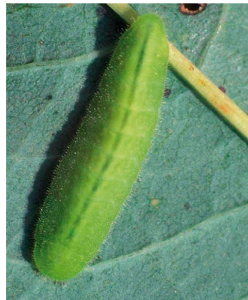
Die Raupe des Blauschillernden Feuerfalters lebt an den Blattunterseiten des Wiesen-Knöterichs. (Foto: Andreas Nunner).

Aufgrund einer stark disjunkten Verbreitung und der rückläufigen