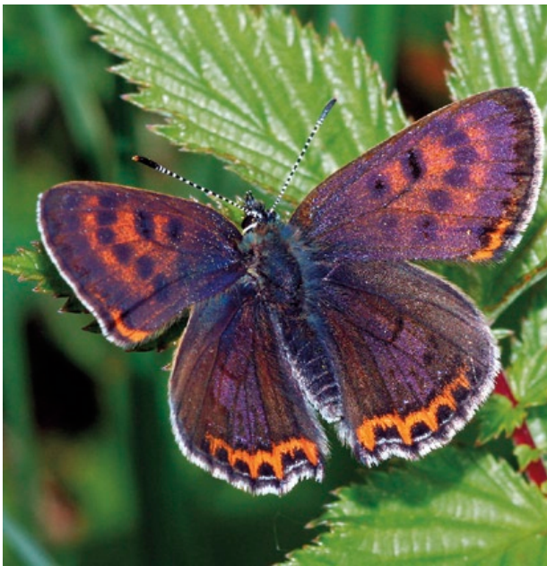
Blauschillernder Feuerfalter, Männchen (Foto: Markus Bräu).