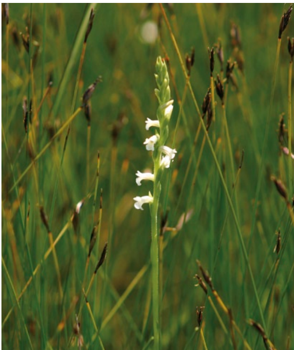
Typisch für die Sommer-Wendelähre ist der schraubig gedrehte Blütenstand mit reinweißen Blüten.