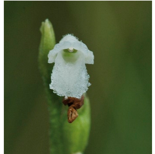
Die zarten Blüten wirken als ob sie aus nur einer Zellschicht bestehen würden (Foto: Andreas Zehm).

Die Sommer-Wendelähre ist eine nach der Bundesartenschutzverordnung besonders geschützte Art. Sie ist zudem im Anhang IV der Fauna-Flora-Habitat-Richtlinie aufgeführt, die die Pflanze unter