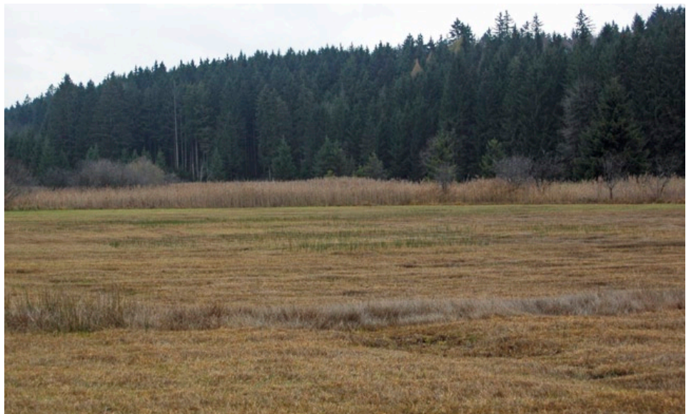
Selbst in wenig produktiven Lebensräumen – der Streifen im Vordergrund zeigt den Aufwuchs eines Jahres – ist eine jährliche Mahd wichtig, um Nährstoffeinträge aus der Luft zu entziehen. Der Streifen wurde belassen, um Tieren eine Überwinterungsmöglichkeit zu geben.

erhöhen die Wuchsleistung der bestandsbildenden Begleitarten. Es verschwinden die zur Besiedlung durch die Wendelähre entscheidenden Lücken in der Vegetationsdecke. Dies geschieht zum einen durch die Ausbildung größerer Horste des Kopfriedes, als auch durch das Aufkommen dichter Bestände der Stumpfbliätigen Binse ( Juncus subnodulosus ).