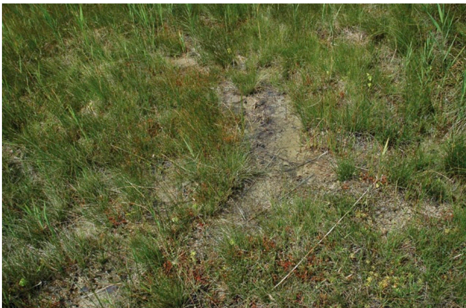
Die Sommer-Wendelähre besiedelt vor allem durchströmte Quellmoore, die durch vegetationsfreie Bodenstellen und Schlenken konkurrenzarme Wuchsorte bieten.

Neben einem intakten Wasserhaushalt benötigt die Wendelähre genau diese geringe Vegetationsentwicklung – ähnlich wie die charakteristischen Begleitarten Langblättriger Sonnentau, Armblütige Sumpfbirse, Saum-Segge, Breitblättriges Wollgras, Gewöhnliche Simsenlilie, Mehlprimel, Sumpf-Herzblatt und Fettkraut. Um sich entwickeln zu können ist die sehr kleinwüchsige Wendelähre auf eine gute Besonnung der bodennahen Rosette angewiesen.