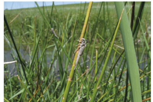
Exuvie von C. ornatum (im Bildhintergrund weitere Exuvie)

Die Vogel-Azurjungfer gehört zur ostmediterranen Refugialfauna (St. QUENTIN 1960). Ihr Hauptverbreitungsgebiet reicht von Südosteuropa über Kleinasien bis in den Iran und Irak (ASKEW 1988). Offenbar ist sie auch dort nicht häufig. Von den deutschen Nachbarstaaten liegen Nachweise aus Österreich, Polen und Frankreich vor. Fundorte in der Schweiz und in Italien gelten als erloschen (WILDERMUTH et al. 2005, STOCH 2003). Die Vorkommen der Vogel-Azurjungfer in Deutschland liegen weit