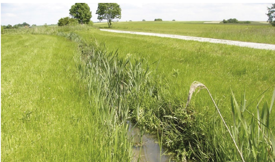
Lebensraum der Vogel-Azurjungfer an einem Wiesengraben im Lkr. Ansbach.

Die Vogel-Azurjungfer ist nach der Bundesartenschutzverordnung eine „streng geschützte Art“ und wird in den Anhängen II und IV der FFH-Richtlinie geführt. Sie lebt im Gegensatz zu anderen gefährdeten Libellenarten oft in naturschutzfachlich weniger wertvollen Gewässern und kann daher mit den Mitteln des Flächenschutzes kaum gefördert werden. Vielmehr ist sie seit langem weitgehend angewiesen auf Sekundärlebensräume, die eng verknüpft sind mit der Wiesennutzung in vernässten Talauen. Die zur Erfüllung der sehr spezifischen Lebensraumansprüche oftmals erforderliche Ufermähd und gelegentliche Räumung der besiedelten Bäche und Gräben ist notwendig, um die Nutzungsfähigkeit der Wiesen zu erhalten. Insofern hängen die bayerischen Vorkommen der Art von der Fortführung einer tradi-