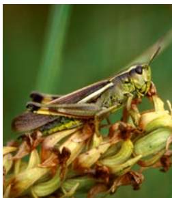
Die Sumpfschrecke ist eine typische Heuschreckenart feuchter bis nasser Wiesen.