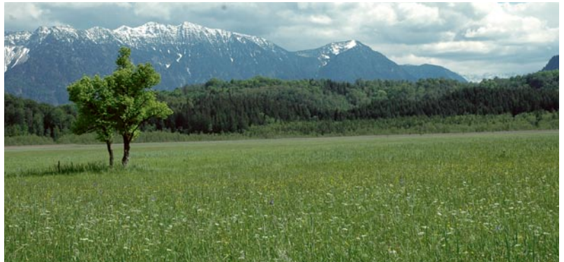
Schwerpunktorkommen von Streuwiesen sind die Tourismus-Landschaften südlich des Chiemsees, das Allgäu und das Loisachtal zwischen Murnau und Garmisch-Partenkirchen.

Durch den hohen Grundwasserspiegel erwärmen sich Streuwiesenstandorte nur langsam. Streuwiesen haben daher meist ein ausgeglichenes und kühlfeuchtes Mikroklima. Der geringe Nährstoff-