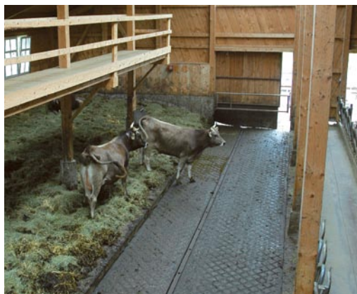
Für die Verwertung von größeren Mengen Streu sind Stallssysteme mit Festmistgewinnung (hier ein Tretmiststall) am besten geeignet.

Manche Betriebsleiter verwenden im Kälberstall keine Streu. Sie befürchten, dass die Streu Nabelentzündungen begünstigt. Es gibt jedoch viele Bauern, die Streu auch im Kälberbereich ohne Probleme einsetzen. Vermutlich ist die Qualität der Streu diesbezüglich ausschlaggebend.