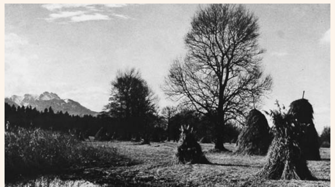
Streuwiesen am Südufer des Chiemsees um 1950.

In den 30er bis 50er Jahren des letzten Jahrhunderts ging der Streuwiesenanteil erstmals massiv zurück. Heute fallen durch die Intensivierung der Landwirtschaft zahlreiche Streuflächen brach und verschwinden.