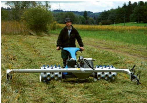
Einachsmähbalken mit Eisenrädern lassen sich auch sehr gut auf steilen Flächen einsetzen.

Brachgefallene Streuwiesen wachsen recht schnell mit Gehölzen zu (z.B. Faulbaum, Fichte, Weide). Derartige Streu ist nicht zu verwerten. Zur Gewinnung von hochwertigem Streumaterial sind Streuwiesen im Abstand von ein oder maximal zwei Jahren zu mähen. Um auf wiederhergestellten Streuwiesen einen angemessenen Nährstoffzug sicherzustellen, müssen diese vorab meist mehrmals pro Jahr gemäht werden. Hat sich hernach eine stabile Streuwiesenvegetation etabliert, kann die Häufigkeit der Mahd reduziert und der Zeitpunkt der Mahd später erfolgen.