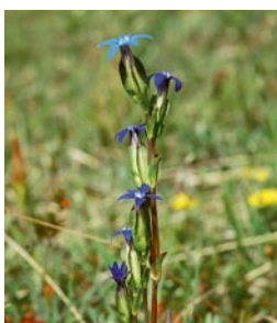
Der Schlauch-Enzian ist im Alpenvorland sehr stark zurückgegangen. Für diese Art hat Bayern eine weltweite Erhaltungsverantwortung.