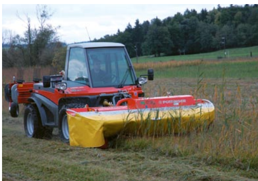
Kreiselmäherwerke erlauben eine hohe Geschwindigkeit und damit verbunden eine hohe Flächenleistung. Allerdings gefährden sie in hohem Maße Kleintiere. Insbesondere wenn Knicker eingesetzt werden, haben Tiere keine Überlebenschance.