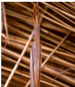
Durch die Eiablage der Fliegenart Liparia lucens entwickeln sich an Schilfstängeln dicke Wucherungen, die von verschiedenen Insekten zur Aufzucht der Larven genutzt werden.

Streuwiesen zeichnen sich durch eine hohe Vielfalt an Pflanzen und Tieren aus. Neben interessanten Gewächsen mit Namen wie Herzblatt, Blutwurz, Wollgras und Fiebertee sind auch bundesweit seltene Pflanzenarten zu finden. Dazu gehören sehr kleinwüchsige Pflanzen, die nur in Streuwiesen genug Sonne bekommen, in denen hochwüchsige Vegetation fehlt. Viele dieser Arten sind bayernweit in der Roten Liste als «vom Aussterben bedroht» verzeichnet. Streuwiesen des Alpenvorlandes sind für manche Pflanzen Schwerpunkte ihres weltweiten Vorkommens, so z.B. für die Sumpf-Gladiole oder den Schlauch-Enzian.