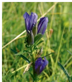
Ab August dienen die Blüten des Lungen-Enzians den Larven des Lungenenzian-Ameisenbläulings (Schmetterling) als einzige Nahrungsquelle, bevor sie sich in die Nester ihrer Wirtameisen eintragen lassen und von diesen füttern lassen. Zu frühe Mahd gefährdet den Lungen-Enzian und den Lungenenzian-Ameisenbläuling.