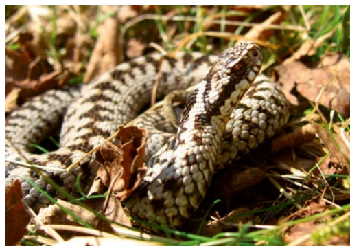
Die tag- und dämmerungsaktive Kreuzotter bevorzugt natürliche oder extensiv genutzte Lebensräume. Die Kreuzotter kommt vorwiegend in [kälteren] Lebensräumen vor und bringt aus diesem Grund lebende Junge zur Welt.

Die Tierarten der Streuwiesen sind an ein Leben unter feuchten Bedingungen angepasst: