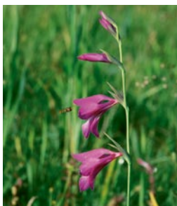
Die Sumpf-Gladiole wird in der Fauna-Flora-Habitat-Richtlinie der europäischen Union genannt. Ihr weltweiter Schwerpunkt ist auf bayerischen Streuwiesen.