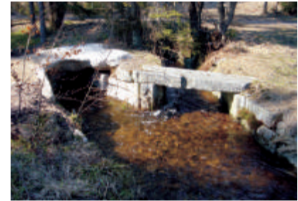
8 Wasserweiche Wohin soll das Holz getriftet werden? Zur Moldau oder über die Hauptwasserscheide zur Donau?