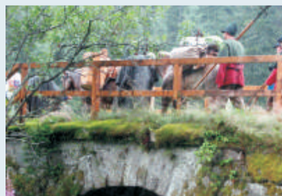
Ein Säumerzug aus Böhmen quert die Steinere Brücke über den Harlandbach.