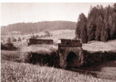
10 Steinere Brücke am Goldenen Steig im Jahr 1936 Hier quert der Goldene Steig den Harlandbach, der seit 1767 Grenzbach ist.