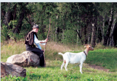
Ein Hirtenjunge hütet Nachbars Ziege auf der Gemeindefeide.