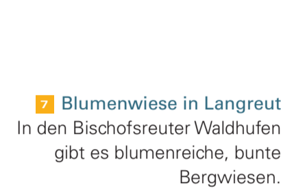
7 Blumenwiese in Langreut In den Bischofsreuter Waldhufen gibt es blumenreiche, bunte Bergwiesen.