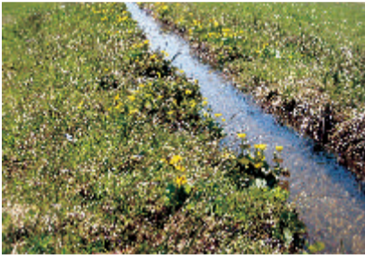
6 Wässergräben in Langreut Eine vergessene Kulturmethode: Werden Wiesen gewässert, bringen sie mehr Ertrag. Durch lange Gräben wird Wasser zu den sogenannten Wässerwiesen geleitet.