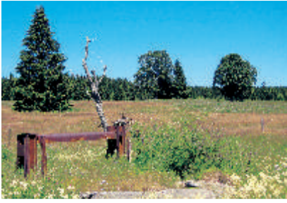
1 Schlagbaum bei Haidmühle Mitten durch die Kulturlandschaft verläuft die Grenze zwischen Deutschland und Tschechien. Sie war 45 Jahre Teil des „Eisernen Vorhangs“, der Europa teilte.