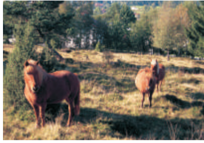
2 Gemeindefeide Bischofsreut Hier weidete früher das Vieh des Dorfes, gehütet vom Dorfhirten. Heute wird die ehemalige Gemeindefeide zeitweise mit Isländern beweidet.