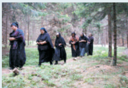
Auf dem alten Kirchsteig zur Notkirche in Bischofsreut sind betende Frauen unterwegs.