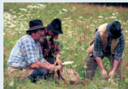
Schmuggler, die hier Schwirzer genannt werden, gehen vor einer Grenzpatrouille in Deckung.

Das „KulturLandschaftsMuseum Grenzerfahrung“ bietet Theaterführungen an, auf denen Vergangenes erlebbar wird.