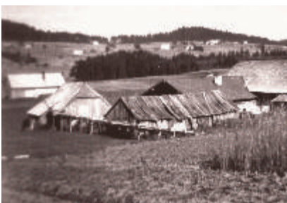
9 Marchmühle in der Bischofsreuter Au im Jahr 1936 Früher waren Mühlen die Energiezentren der Kulturlandschaft.