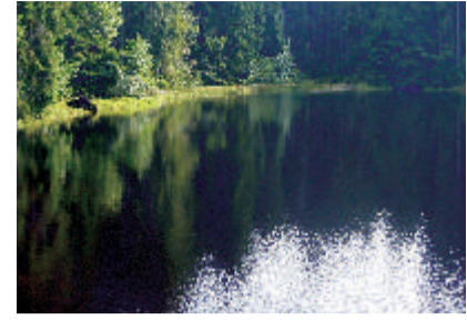
5 Kreuzbachklause am Dreisessel In solchen Stauweihern (=Klausen) wurde im 19. Jahrhundert Wasser zum Holzschwemmen gesammelt. In Triftkanälen wurde das Holz zu den Flüssen geschwemmt.