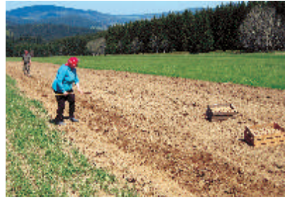
3 Acker in Langreut Auch heute gibt es noch kleinbäuerlichen Kartoffelanbau, hier auf einem der letzten Äcker der Waldhufenflur in 920 m Höhe.