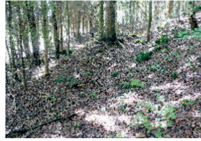
4 Hohlweg des Goldenen Steigs Im Wald finden sich verborgene Spuren eines historischen Handelswegs von europäischer Bedeutung.