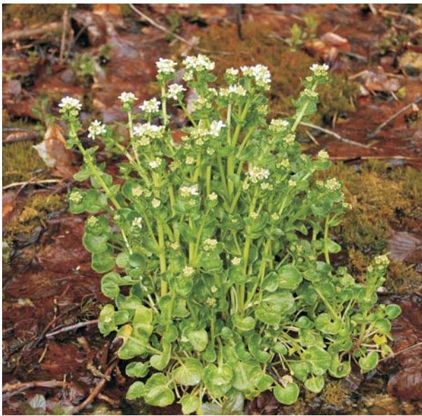
Die typischen, löffelartigen Grundblätter sind namensgebend für die Löffelkräuter.