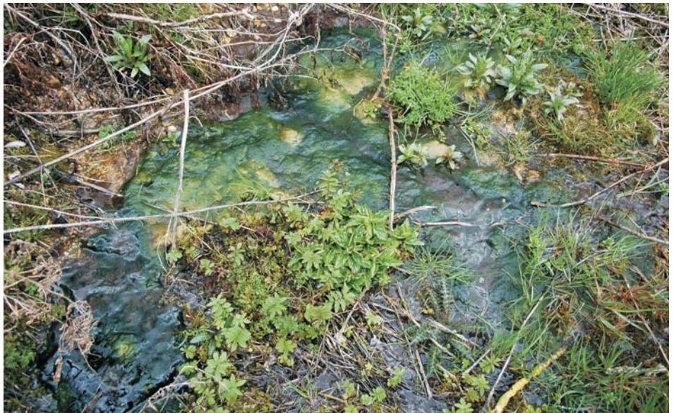
Starkes Algenwachstum ist ein guter Indikator für ein mit Nährstoffen verschmutztes Quellwasser. An solchen Wuchsorten können Löffelkräuter nicht überleben.

Quellschüttung vielerorts zurückgegangen. Quellen versiegen oder die Quellschüttung reicht nicht mehr zur Ausprägung eines quelltypischen Lebensraumes aus.