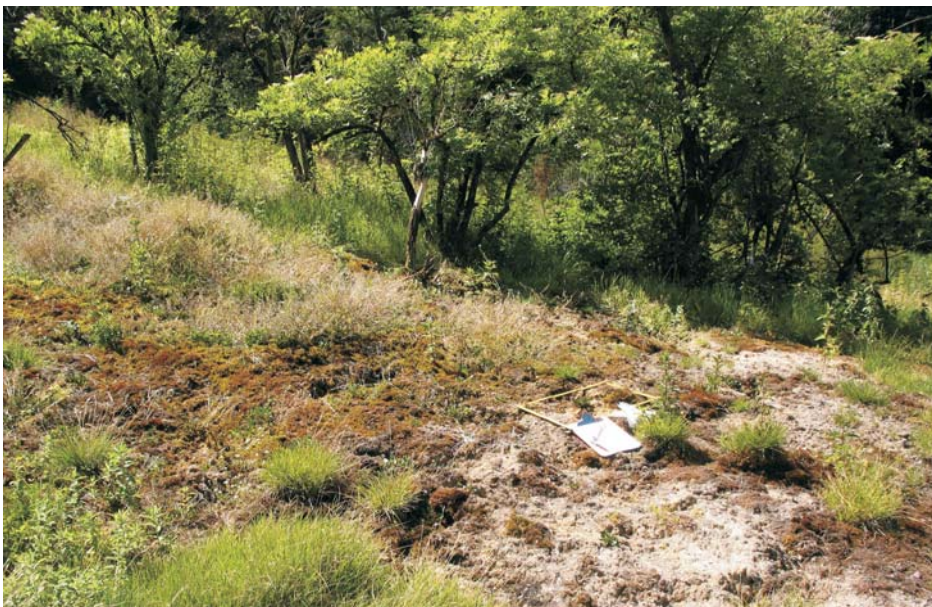
Auf den nur von wenigen Pflanzenarten besiedelbaren Quelluffen und Sinterterrassen haben Quellmoose und das Bayerische Löffelkraut nur wenig Konkurrenz.

sers, wodurch die pflanzenverfügbare Kalium- und Phosphat-Versorgung sehr gering ist. Für zahlreiche Pflanzenarten stellt dieses unausgeglichene Nährstoffangebot den ausschlaggebenden Minimumfaktor für die Besiedlung dar (Abs 2002). Cochlearia bavarica besiedelt stark besonnte Standorte bis hin zu fast geschlossenen Wäldern. Bei Quellfluren in Wäldern, verhindern deren extreme Standorteigenschaften einen Kronenschluss. Der Standort ist gekennzeichnet durch flächendeckende Vorkommen des Straknervenmoos ( Cratoneuretum commutatae ), poröse Sinterkaskaden (Tuffstein) oder unverwitterte, kiesige Schotterflächen. Die Substratverhältnisse, die Quellschüttung und das Relief führen zu mehr oder weniger großen Waldlichtungen. Im Schatten werden die Pflanzen großblättrig und der Anteil blühender, reproduktiver Individuen ist geringer. Im Offenland kommen die Individuen dagegen gut zur Reproduktion, was die Ausbreitung auf neue Wuchsplätze ermöglicht. Die eigentliche Quellflur wird häufig von Riesenschachtelhalm-Eschenwäldern oder Winkel-