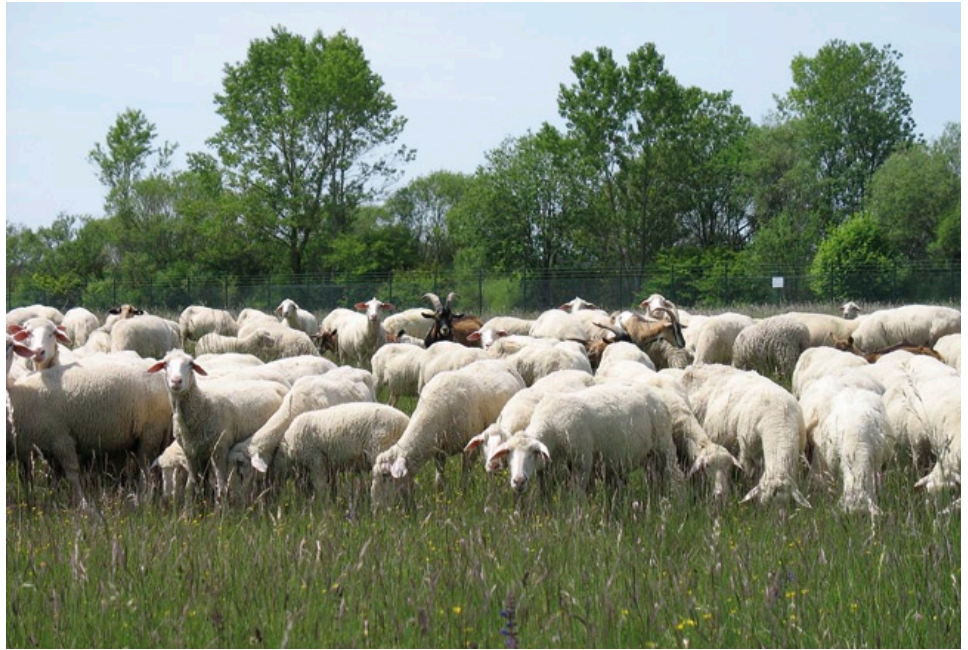
Beweidung mit Landschafen und einzelnen Ziegen zur Offenhaltung der Magerrasen.

Die Entwicklung der Populationen besonders auf den seit 1995 wieder beweideten Flächen ist in den letzten Jahren leicht positiv. In eigens für diese Art eingerichteten Dauerbeobachtungsflächen wird die Bestandszunahme durch punktgenaues Einmessen sämtlicher Steppengreiskraut-Individuen seit fünf Jahren dokumentiert (MEINDL briefl.). Besonders auffällig war, dass die Zahl an Jungpflanzen in den Jahren 2008 und 2009 enorm zunahm. In Bereichen mit vielen offenen Bodenstellen traten deutlich mehr junge Blattrosetten des Steppengreiskrautes auf. Diese Bestandsverjüngung ist auf die Verbesserung der Lebensraumqualität für das Augsburger Steppengreiskraut zurückzuführen. Die reine Erfassung blühender Individuen liefert bei dieser Art kein aussagefähiges Bild zur Beurtei-