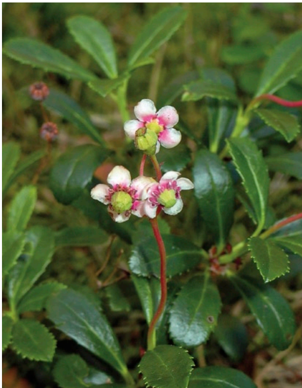
Blütenstand des Dolden-Winterliebs ( Chimaphila umbellata ) inmitten einer Gruppe von Trieben.