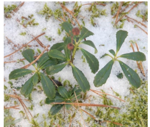
Der deutsche Name des Doldigen Winterliebs beruht darauf, dass die immergrüne Pflanze auch im Winter grüne Blätter hat.

Nach der Bundesartenschutzverordnung (BArtSchV) ist Chimaphila umbellata besonders geschützt.