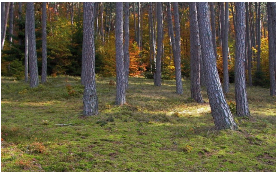
Eine Vielzahl von Wuchsorten des Winterliebs liegt in lichten Kiefernwäldern, die sich durch eine ausgeprägte Moosschicht und eine fehlende Strauchschicht auszeichnen.

In Deutschland ist Chimaphila umbellata als „stark gefährdet“ eingestuft. Das Winterlieb weist in Brandenburg noch mehrere, weniger bedrohte Vorkommen auf. In den westlichen Bundesländern kommt es entweder nicht vor, ist „vom Aussterben bedroht“ oder „ausgestorben/verschollen“. Bayernweit ist ein starker Rückgang zu verzeichnen, so dass das Winterlieb als „vom Aussterben bedroht“ gilt. Regional ist es bereits „ausgestorben/verschollen“ (Ostbayerisches Grenzgebirge) oder kommt gar nicht vor (Alpen, Alpenvorland). Mehrere historische bayerische Wuchsorte sind inzwischen verwaist. Allein im Landkreis Kelheim konnten vier überlieferte Fundor-