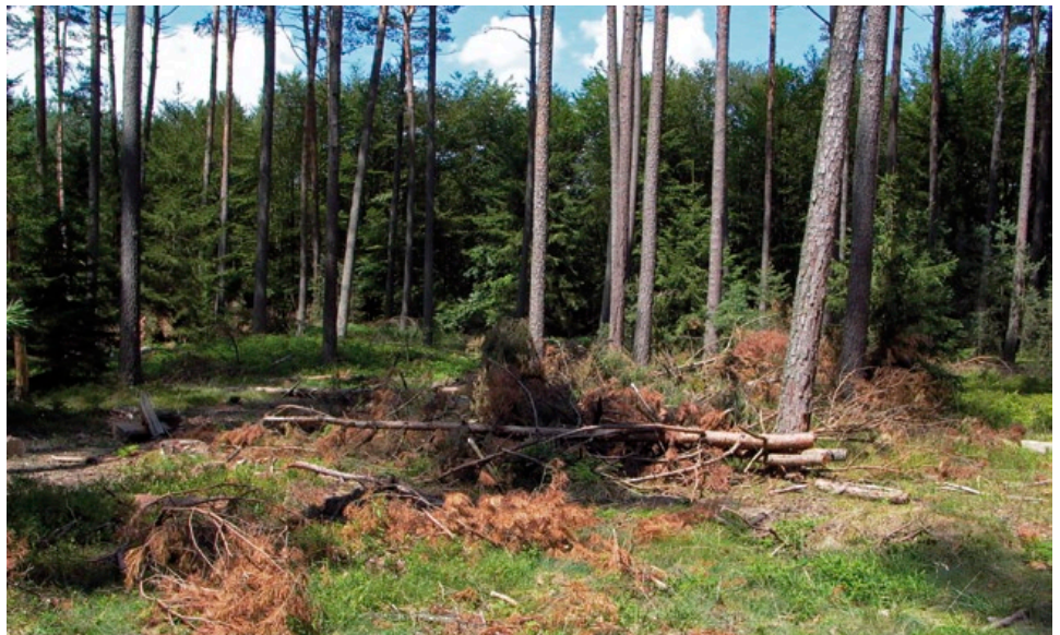
Nach Forstarbeiten zurückgelassene Äste und Baumwipfel können – ebenso wie das Befahren mit Forstmaschinen – zum Absterben von Winterlieb-Trieben führen.