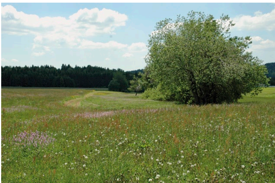
Optimaler Wuchsort des Böhmisches Enzians auf einer artenreichen Wiese mit mittleren Nährstoff- und Feuchtigkeitsverhältnissen im Bayerischen Wald.

Das Lebensraumspektrum des Böhmisches Enzians ist breit. Neben Borstgrasrasen gibt es Vorkommen in mittel-nährstoffreichen und teilweise feuchten Wiesen, sowie in trockenerem, basenreicherem Grasland (Bromion und Koelerio-Phleion) und in mageren Rotschwengel-Rotstraußgras-Wiesen. Die bayerischen Vorkommen finden sich alle auf Borstgrasrasen und mageren Rotschwengel-Rotstraußgras-Wiesen in rauen Klimaten des Bayerischen Waldes auf 700–880 m Meereshöhe.