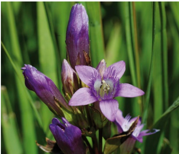
Typische, durch Schlundschuppen bärtig gesäumte Blüte des Böhmischen Enzians (Foto: Andreas Zehm).

Kelchzipfel sind 1- bis 1,5-mal so lang wie die Kelchröhre; ihr Rand ist deutlich zurückgerollt. Fruchtknoten und Samenkapsel sind 2–6 mm lang gestielt.