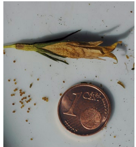
Die sehr schwierige Nachzucht in Botanischen Gärten von Gentianella bohemica erfolgt aus Samen, die im Freiland gewonnen werden.