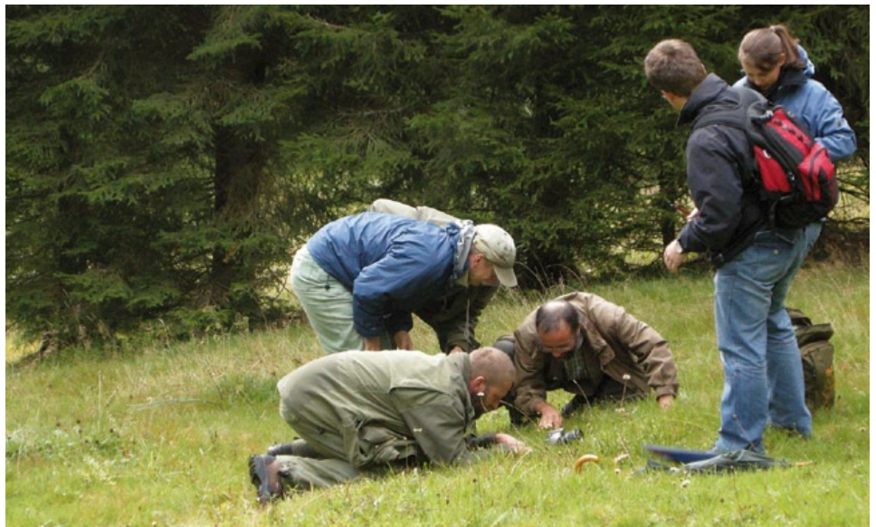
Um die Biologie und Ökologie des Böhmisches Enzians besser zu verstehen ist ein internationaler Wissensaustausch – wie auf dieser Expertenexkursion – notwendig.

allen bayerischen Wuchsorten sind negative Effekte durch genetische Verarmung zu befürchten. An Wuchsorten mit wenigen Enzian-Individuen wurden bereits besonders kleine Samen festgestellt.