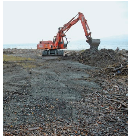
Nur mit einem Bagger konnten die 2005 angeschwemmten Treibholzmassen und Feinteilüberdeckungen abgetragen werden.

Aber auch zu lange sommerliche Überflutungen von mehr als fünf Monaten schädigen die Pflanzen bis hin zum Absterben (z. B. durch Algenbeläge auf den Blättern), weshalb die Bestandszahlen in Abhängigkeit von der Überflutungsdauer stark schwanken.