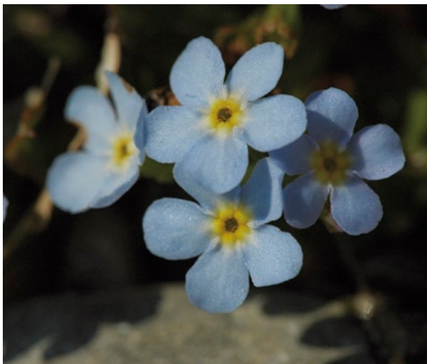
Charakteristisch dichter, himmelblauer Blütenstand eines Bodensee-Vergissmeinnicht-Polsters.

Familie: Rauhbblattgewächse (Boraginaceae)