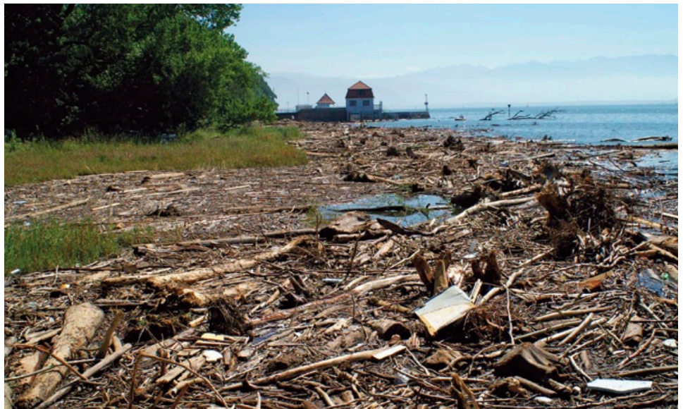
Nach Unwettern im Einzugsbereich des Alpenrheins – hier August 2005 – kommt es in der Lindauer Bucht zur Anlandung von Unmengen von Treibholz jeder Größenklasse.