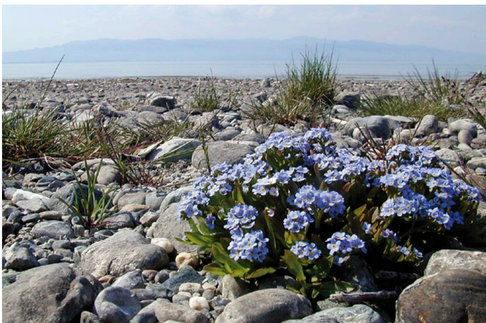
Der periodisch trockenfallende Lebensraum im Übergangsbereich von Land zu Wasser ist durch anstehenden, kaum bewachsenen Kies geprägt.

Während sie das winterliche Trockenfallen problemlos übersteht, ist sie gegenüber Sommertrockenheit empfindlich. Sie siedelt daher vorwiegend an Quellwasser beeinflussten Uferbereichen, an denen sie auch Jahre übersteht, in denen die sommerliche Überflutung ausbleibt.