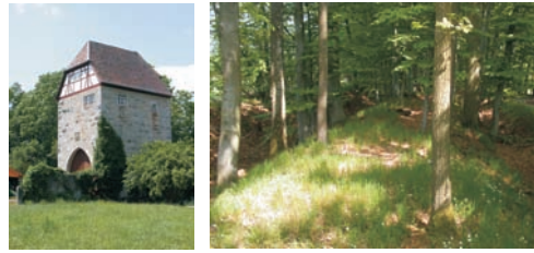
Landturm von Oberrimbach-Lichtel und Abschnitt der Landhege bei Großharbach. Gut zu erkennen ist der mittlere Wall, der von dem inneren und äußeren Wall durch Gräben getrennt ist.

Von den Segnungen des Industriezeitalters vergessen, versank die Stadt Rothenburg in einen Dornröschenschlaf. Mit der Reichsgründung im Jahr 1870/71 und dem aufkommenden Fremdenverkehr, begünstigt durch den Eisenbahnanschluss Rothenburgs 1873, eröffneten sich neue Perspektiven für die Stadtentwicklung. Insbesondere nach dem 2. Weltkrieg wurde der Tourismus erheblich gefördert, so dass die Stadt Rothenburg ob der Tauber als Fachwerkstadt weltweit bekannt wurde.