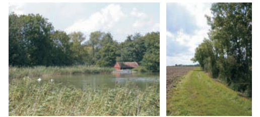
Die Lindleinseen und der von Gehölzen gesäumte Bauerngraben als Bestandteil einer Verteidigungslinie, die sich im Halbkreis um die Stadt Rothenburg zog. Die Lindleinseen dienen auch der Fischzucht.

Auch die zu Beginn des 15. Jahrhunderts geschleiften Burgen, wie z. B. Endsee, Nordenberg oder Lichtel, sowie die zahlreichen Wehkirchen des Rothenburger Landgebiets verdeutlichen die reichsstädtische Prägung der Kulturlandschaft. Innerhalb der Landhege bestand eine Verteidigungslinie aus einer über Bachläufe und Wassergräben verbundenen Weiherkette, die sich vom Steinbachtal im Norden östlich um die Stadt Rothenburg zog.