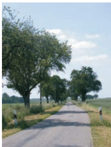
Birnbäumallee bei Schöngiras