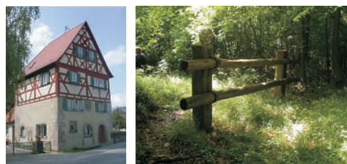
Rekonstruierter Riegel im Galgenholz bei Reichardsroth. In Großharbach steht ein weiterer Landturm der Landhege, von denen es einst neun gab.

Ferner existierten 14 „Riegel“ (Durchgänge) und Schlupfe. Die Riegel bestanden aus zwei dicken Stangen, die quer an Pfosten angebracht werden konnten und verschließbar waren. Ein Riegel wurde bei Reichardsroth rekonstruiert. Für die Schlupfe wurden ein bis zwei Balken über die Gräben gelegt, die so einer Person ein Durchschlüpfen ermöglichten. Entlang der westlichen Grenzanlage wurden im 15. Jahrhundert neun Landtürme errichtet, von denen noch zwei gut erhalten sind.