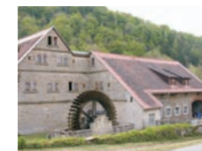
Langenmühle bei Detwang

Der Wein- und Obstbau diente der Versorgung der lokalen Bevölkerung. Urkundlich nachweisbar ist der Weinbau zu Füßen der Stadt Rothenburg ab etwa 1100. Die Chorherren von Herrieden förderten den Weinbau um Tauberzell, der bereits für 1288 belegt ist. Heute liegt die Mehrzahl der Weinberge brach und wird u. a. von Streuobstwiesen eingenommen.