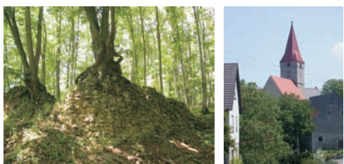
Burgruine Seldeneck und Wehrkirche in Finsterlohr als markante Geschichtszeugnisse. Sie stehen stellvertretend für die vielen Burgruinen und die Wehkirchen im Rothenburger Landgebiet.

Mit dem Ende des Alten Reiches setzte eine territoriale Neuordnung ein. Sie bedeutete für das protestantische Rothenburg o. d. T. die Mediatisierung, d. h. den Verlust der Landeshoheit, und in Folge dessen die Zweiteilung des reichsstädtischen Landgebiets. 1803 fielen die Stadt Rothenburg und der Hauptteil des Landgebiets an das Königreich Bayern. Die westlich der oberen Tauber liegenden Gebietsteile um Brettheim und Leuzendorf, um Gammesfeld, Finsterlohr und Oberrimbach gingen 1810 an das Königreich Württemberg.