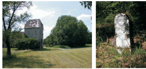
Die Landhege bei Oberrimbach-Lichtel als Gehölzband. Die Hegesteine entlang der Landhege tragen jeweils das Wappen der Stadt Rothenburg (zwei Türme) und das Zollerschild der Ansbacher Markgrafen.

Die Rothenburger Landhege ist ein historischer Grenzweg, der das Rothenburger Landgebiet in seinen Außengrenzen umgab und als Frühwarnsystem gegen feindliche Übergriffe diente. Ferner ermöglichte die Landhege die Kontrolle des Verkehrs, insbesondere der Aus- und Einfuhr. Die Arbeiten an der Rothenburger Landhege haben schon um 1400 begonnen und wurden bis zum Ende des 15. Jahrhunderts abgeschlossen. Im Osten des Rothenburger Landgebiets stellte die Frankenhöhe mit ihren bewaldeten Steilhängen ein 58 km langes natürliches Hindernis dar, das mit Hegesteinen markiert wurde. Westlich wurde ein 62 km langes Graben-Wall-Graben-System errichtet, das auch Teiche mit einschloss.