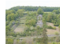
Alte Weinberge mit Lesesteinriegel bei Tauberzell