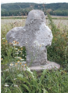
Langmantelkreuz bei Wettringen

Aufbauend auf die kulturhistorische Spurensuche sind diejenigen Kulturlandschaftselemente in das Blickfeld gerückt worden, die einen hohen historischen Zeugniswert besitzen und auf besondere Weise die Eigenart der Kulturlandschaft prägen. Diese identitätsstiftenden Landschaftsbausteine können für den Tourismus in der Region sehr gewinnbringend eingesetzt werden.