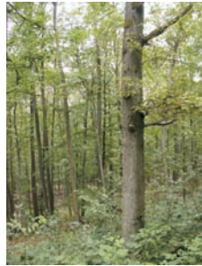
Eichenschälwald am Oestheimer Berg

Hauptattraktion sind die erhaltenen Abschnitte der Landhege in Verbindung mit den Landtürmen, Grenzsteinen, Wehkirchen, Burgruinen und Weihern als eindrucksvollem Zeugnis mittelalterlicher Befestigungskunst. Ferner können alte Schafhöfe, Alleen, Hutanger und die Dörfer mit ihrer wertvollen Bausubstanz in Augenschein genommen werden.