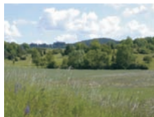
Hutung bei Kirnberg