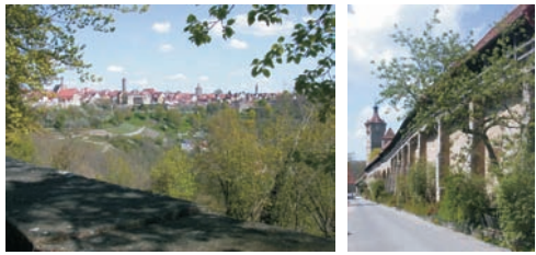
Blick von der Alten Burg auf die befestigte Stadt Rothenburg ob der Tauber. Das Bild rechts zeigt die überdachten und begehbaren Wehrgänge beim Klingenschütt in Rothenburg.

Rothenburg o. d. T. kann auf eine lange und ereignisreiche Geschichte zurückblicken. Mit der Verleihung der Stadtrechte an Rothenburg im Jahr 1172 wurde mit dem Bau der Befestigungsanlagen begonnen. Durch Stadterweiterungen im Laufe des 13. und 14. Jahrhunderts erhielt der Verteidigungsring seine heutige Länge. Bis heute wird die Stadt Rothenburg von einer 3,4 km langen Stadtmauer mit 43 Tor- und Mauertürmen umgeben. 1274 erhob Kaiser Rudolf I. Rothenburg zur Freien Reichsstadt. Erst 1802, nach 528 Jahren, sollte die Stadt ihre Landeshoheit verlieren.