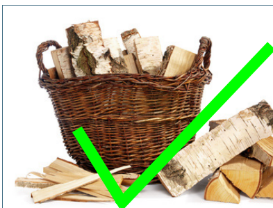
Abb. 5: In Kaminöfen dürfen nur naturbelassenes Scheitholz oder daraus hergestellte Briketts verbrannt werden.

Die für Kaminöfen zugelassenen Brennstoffe sind in der Bedienungsanleitung des Herstellers genannt. Altholz und Rindenbriketts dürfen in Kaminöfen nicht verbrannt werden.