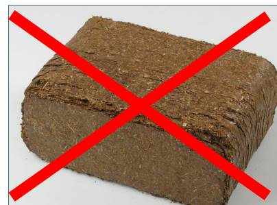
Abb. 7: Auch Rindenbriketts dürfen in Kaminöfen nicht verbrannt werden, der hohe Gehalt an Salzen führt zu sehr hohen Staubemissionen.