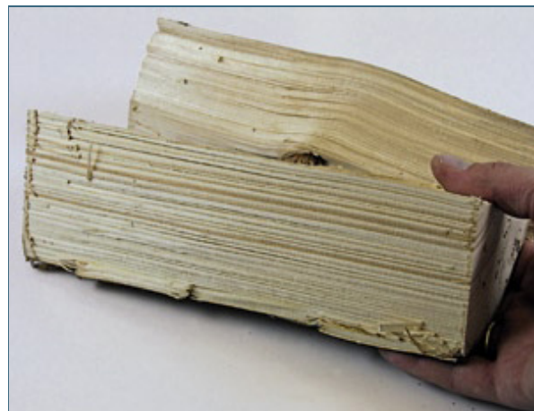
Abb. 10: Für einen 6-kW-Ofen sind 1 kg Fichtenholz jede halbe Stunde optimal, das sind zwei kleine Scheite.