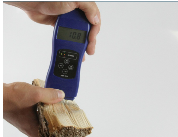
Abb. 4: Brennholz muss trocken sein: Es darf maximal 25 Prozent Wasser enthalten.

Verbrennt man Gebrauchtholz, gelangen aus den Lackierungen, Holzschutzmitteln oder Anstrichen umweltschädliche, teils krebserzeugende Stoffe mit dem Abgas in Ihre Nachbarschaft. Nur naturbelassenes Holz kann in Kaminöfen schadstofffrei verbrennen.