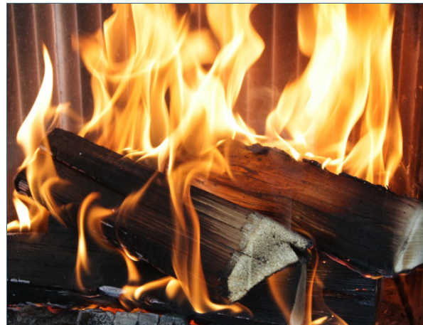
Abb. 9: Verbrennungsluftzufuhr vermindern, sobald der Verbrennungsvorgang in Gang gekommen ist.