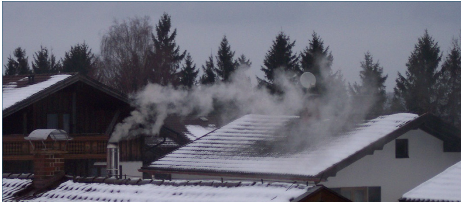
Abb. 1: Holzöfen können den Gehalt an Feinstaub in der Umwelt enorm erhöhen – vor allem wenn ältere Anlagen und nicht zugelassene Brennstoffe verwendet werden.

Ob der Feinstaub in der Luft aus Holzfeuerungen stammt, lässt sich anhand des Kalium-Gehalts im Feinstaub ermitteln. Kalium ist in Holz in relativ hohen Konzentrationen enthalten, dagegen kaum in Benzin, Heizöl und Gas. Das im Gesamtfeinstaub enthaltene Kalium stammt daher überwiegend aus der Holzverbrennung.