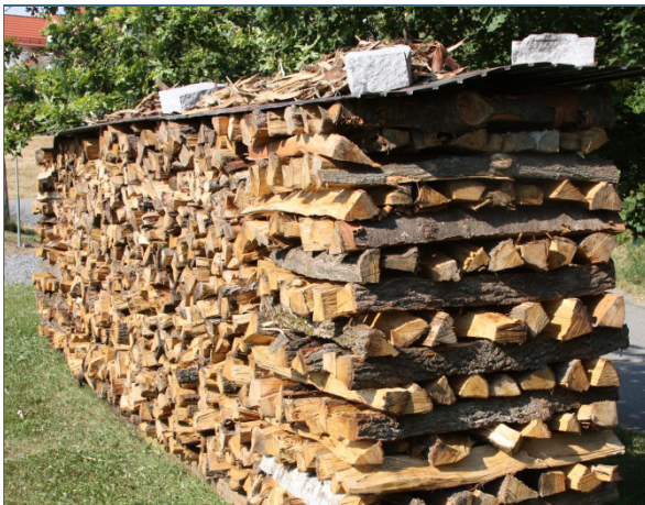
Abb. 3: Vor dem Einsatz muss erntefrisches Holz ein bis zwei Jahre gelagert werden.

Wird feuchtes Holz verbrannt, geht viel Energie für die Verdampfung des im Holz enthaltenen Wassers verloren – und das Feuer wird nicht sehr heiß. Da Holz nur bei ausreichend hohen Temperaturen sauber verbrennt, darf der Feuchtegehalt von Brennholz 25 Prozent nicht überschreiten.