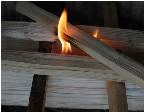
Abb. 8: Wird von oben angeheizt, treten weniger unverbrannte Brenngase aus als wenn von unten angeheizt wird.