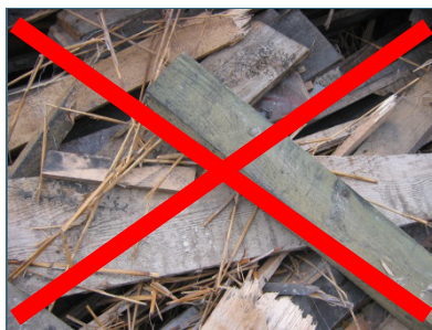
Abb. 6: Altholz darf in Kaminöfen nicht verbrannt werden, es enthält zu viele Schadstoffe.