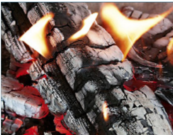
Abb. 9: Kurz bevor die Flamme erlischt, ist der richtige Zeitpunkt zum Nachlegen.

In Kaminöfen wird häufiger eine kleine Brennstoffmenge nachgelegt. Es gilt: je Kilowatt (kW) Nennwärmeleistung halbstündlich 0,15 kg Holz. Die Scheite sollten waagrecht und mit der Spaltkante nach unten oder zur Seite auf das Glutbett gelegt werden.