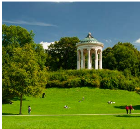
Abb. 3: In Parks oder am Stadtrand sind die Ozonkonzentrationen oft höher.