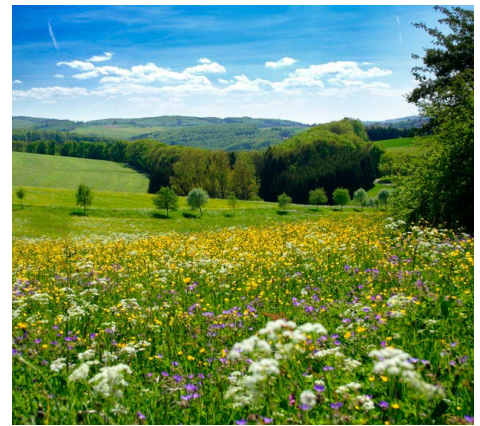
Abb. 4: Besonders viel Ozon misst man an heißen Sommertagen auf dem Land.