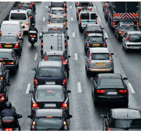
Abb. 2: An verkehrsreichen Straßen im Stadtgebiet ist die Ozonkonzentration gering.