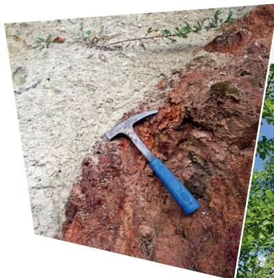
Grauer Suevit überlagert die rötliche Bunte Breccie.

Erst seit der Mondlandung weiß man endgültig, wie Gesteinsveränderungen aussehen, die durch einen Asteroiden-Einschlag, einen sogenannten „Impakt“, verursacht werden ... und dass das „Nördlinger Ries“ ein Impaktkrater ist und nicht, wie lange angenommen, vulkanischen Ursprungs.