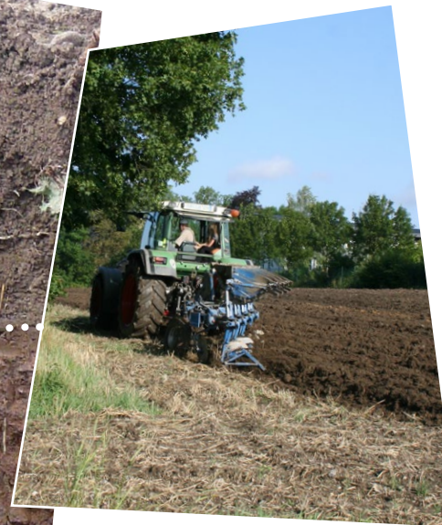
Eines haben alle Ackerböden gemeinsam – die zirka 30 Zentimeter tiefe Ackerkrume, die durch das Pflügen entsteht.