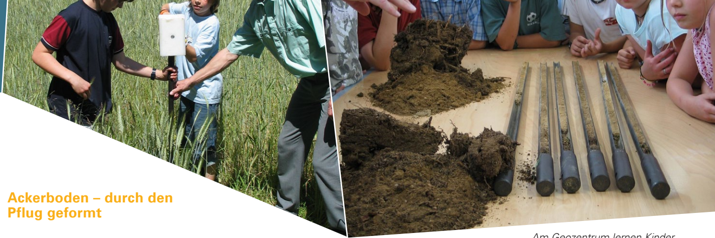
Am Geozentrum lernen Kinder, wie der Boden aufgebaut ist.

Seit etwa 11.000 Jahren betreibt der Mensch Ackerbau und wirkt so direkt auf die natürliche Bodenentwicklung ein. Bewusstsein dafür schafft die Umweltstation „GEO-Zentrum an der KTB“ mit vielfältigen Aktivitäten. Der Ackerboden bei Windischeschenbach wurde daher als bayerischer Vertreter des Boden des Jahres 2023 ausgezeichnet.