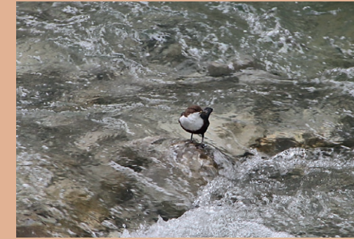
Mit etwas Glück und Geduld können Sie eine Wasseramsel beobachten. ▶