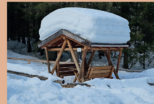
Auch im Winter lohnt sich ein Besuch. ▶