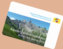
Alpiner Felshumusboden, Boden des Jahres 2018 (Station 6)

Die Stationen 1 bis 8 und die Landschaft um die Schwarzentennalm kann man auch „erfahren“.