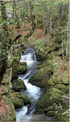
Tief ist der Bachlauf in den Fels eingeschnitten.