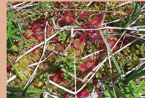
Im Moor leben fleischfressende Pflanzen. Vorsicht 😊 ▶