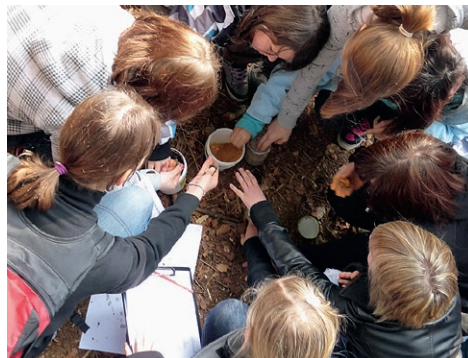
Schüler erfahren und bestimmen verschiedene Bodenarten.

Der Bodenerlebnispfad wird vom Bildungszentrum des Klosters, der Gemeinde und dem Wasserwirtschaftsamt Donauwörth betreut. Im Bildungszentrum finden viele Umweltprojekte und Veranstaltungen statt. Darunter auch Aktionen rund um das Thema Boden, die Groß und Klein gleichermaßen die empfindliche „Haut der Erde“ näher bringen.