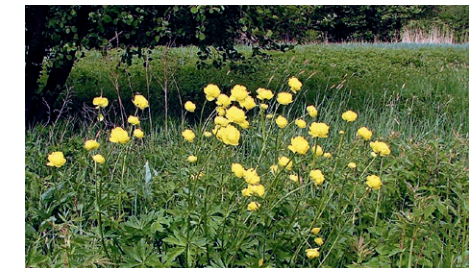
Feuchtwiese mit Trollblumen und Seggen

Der beinahe ganzjährig nasse Gleyboden bietet im besonderen Maß Lebensraum für seltene Pflanzen, die mit der Dauerfeuchte umgehen können. Im Wald sind zum Beispiel der Sumpf-Pippau und auf Feuchtwiesen die Trollblume oder verschiedene Seggen anzutreffen.