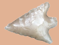
Pfeilspitze aus hellem Feuerstein