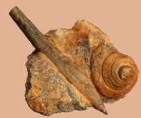
Belemnit (Teufelsfinger) mit Schnecke

Herzlich willkommen am Bodenerlebnispfad Flintsbach! Bei einem Spaziergang von ca. 800 m Länge können Sie mit allen Sinnen den Boden, die „Haut der Erde“ erleben. An 14 Stationen wird zum Anfassen und Mitmachen, zum genauen Hinsehen und Entdecken eingeladen.