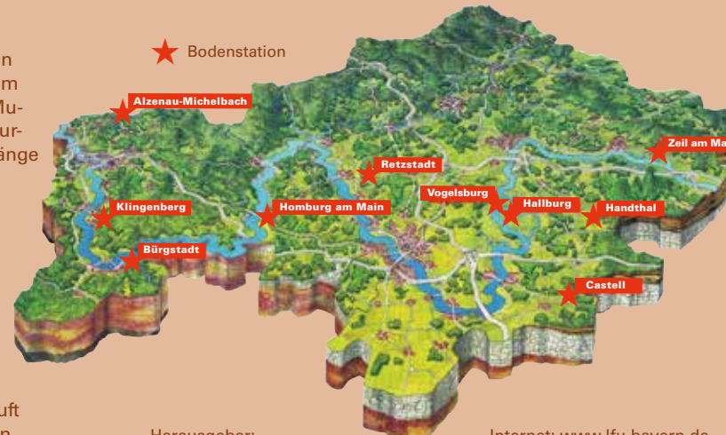
Abb.: Regierung von Unterfranken

befindet sich am Weinwanderweg „Abt-Degen-Steig“ in Ziegelanger, oberhalb des weithin sichtbaren „Gesichtshäusla“, etwa 1,5 km östlich von Zeil am Main. Aus den farbenfrohen Lehrbergsschichten des Gipskeupers hat sich eine flachgründige Rendzina entwickelt.