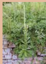
Kleinblütige Königskerze ( Verbascum thapsus ) an der Weinbergsmauer