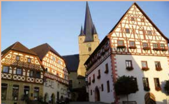
Zeil am Main: Historisches Rathaus mit alter Apotheke und Kirche.

Die Bodenstation Zeil am Main befindet sich am Weinwanderweg „Abt-Degen-Steig“ in Ziegelanger, oberhalb des weithin sichtbaren „Gesichtshäusla“!