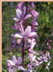
Diptam (Dictamnus albus)

Geologisch liegt die Bodenstation in der jüngsten Abfolge des Gipskeupers in den Lehrbergsschichten. Es dominieren hier rötliche Tonsteine, die von hellen Gipslagen durchzogen werden. Bei dem Bodentyp, der sich aus diesem Material entwickelt hat, handelt es sich um eine flachgründige Rendzina. Der karbonathaltige Oberboden ist humus- und nährstoffreich und bietet auch seltenen Pflanzen – wie z. B. dem Diptam – gute Wuchsbedingungen.