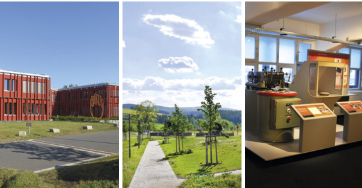
Beispiele für gelungenes Flächenrecycling in Bayern (von links nach rechts): Amt für Ländliche Entwicklung auf dem ehemaligen Bahnhofsgelände in Tirschenreuth Bürgerpark auf einer ehemaligen Porzellanbrache in Krummennaab Porzellanmuseum in Mitterteich

Gedruckt als Broschüre oder als PDF zum Download