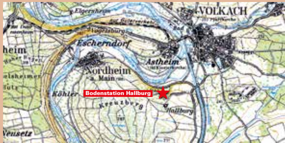
Quelle: Bayerisches Landesvermessungsamt