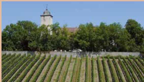
Die Hallburg bei Volkach

Die Bodenstation Hallburg befindet sich direkt in der Mainschleife von Volkach auf dem Weinberg des Grafen von Schönborn.