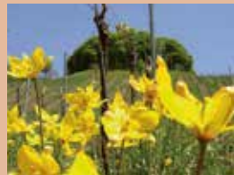
Weinbergstulpe ( Tulipa sylvestris )