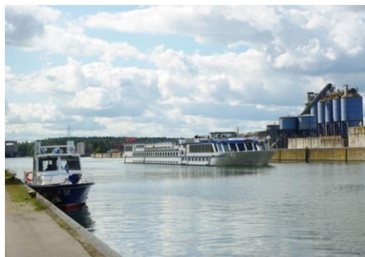
Die Beprobung von Schiffskläranlagen wird vom Bayerischen Landesamt für Umwelt zusammen mit der Wasserschutzpolizei durchgeführt.

In Bayern sind die Bundeswasserstraßen Main, Main-Donau-Kanal und Donau von den gesetzlichen Regelungen betroffen. Die Kreisverwaltungsbehörden und die Regierung der Oberpfalz sind zuständig beim Vollzug des CDNI-Übereinkommens und des hierzu erlassenen Ausführungsgesetzes an Land. Für die Überwachung hinsichtlich der Einhaltung der Vorschriften auf dem Wasser ist die Wasserschutzpolizei zuständig. Diese überprüft zudem auch die Erfüllung der technischen Vorgaben für Kläranlagen gemäß der BinSchUO.