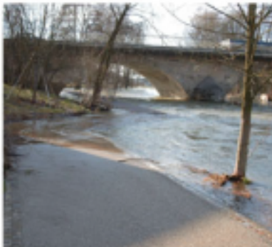
Mittlere Weisenflächen - Steg