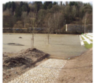
Zentrales Ausstellungsgelände - Stafflermasse