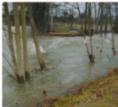
Südliche Weisenflächen - Zusammenfluss Haselach und Rodach