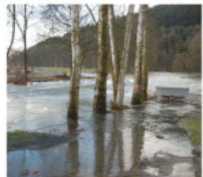
Hörngarten - Aussichtspunkt Zusammenfluss Haselach und Rodach