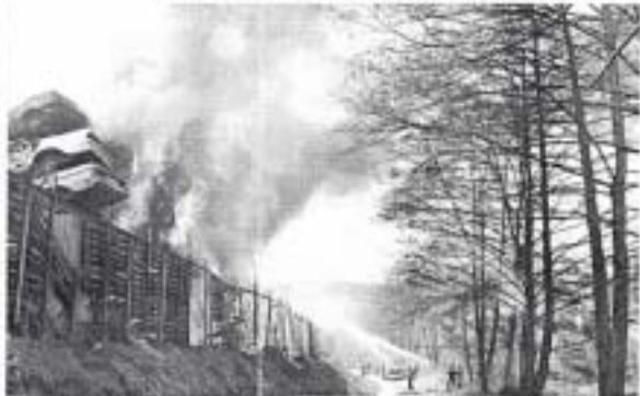
Mit 2000 Litern Löschwasser pro Minute bekämpfte die Feuerwehr den Brand (Bild links). Auch von der Flußseite aus bekämpften die Wehrmänner das Flammenmeer (Bild rechts). Die Wasserversorgung war so stark, daß die Leuchtkäme am Kronacher Feuer fliegen.