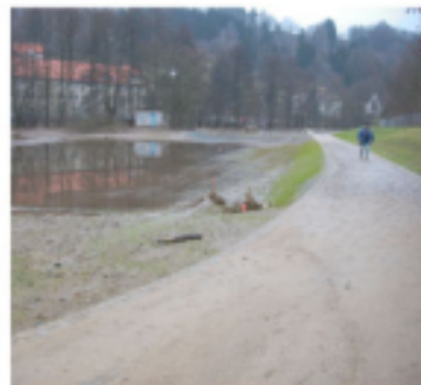
Mittlere Wasserflächen - Bolzplatz