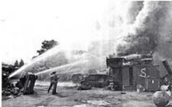
Mit 2000 Litern Löschwasser pro Minute bekämpfte die Feuerwehr den Brand (Bild links). Auch von der Flußseite aus bekämpften die Wehrmänner das Flammenmeer (Bild rechts). Die Wasserversorgung war so stark, daß die Leuchtkäme am Kronacher Feuer fliegen.

Das Hotel Kronach mußte zwei Personen, die Feuerwehrlöcher öffnen wollten, umgeben. Wegen der starken Rauchentwicklung wurden vorwiegend die Brandlöschungswagen, Kronach, Scheidebach und Mörnsdorf alarmiert, die mit 16 Kanistern und sechs Autos am Einsatzort waren.