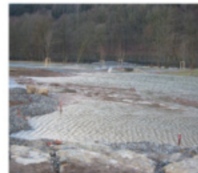
Südliche Weisenflächen - Abenteuerplatz