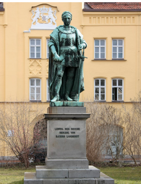
Das Flussgoldwaschen an der Isar ist erstmals 1477 dokumentiert. Damals schloss Herzog Ludwig IX. der Reiche (1417–1479) einen Vertrag, der das Goldwaschen an der Isar zwischen Moosburg und Plattling regelte. Sein Denkmal steht in seiner Residenzstadt Landshut am Dreifaltigkeitsplatz.