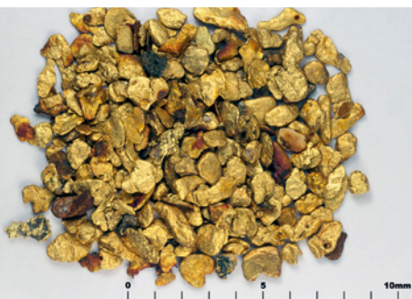
Im Gegensatz zum Rheingold ist das Waschgold vom Obermain etwa 10- bis 15-mal größer, im Schnitt 1,0 bis 1,5 Millimeter.

von 1784 zusätzlich die Gebühren für die Ausstellung der Goldwaschpatente ab. Aber all diese Maßnahmen halfen nicht, die Goldförderung im großen Stile anzukurbeln. Die Goldgehalte in den bayerischen Flüssen waren nicht hoch genug, um davon zu leben.