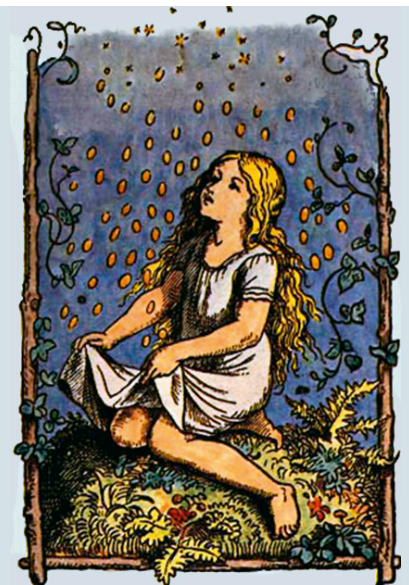
Im Grimm'schen Märchen „Die Sterntaler“ fallen Goldmünzen vom Himmel.

Rechts: Stater-Münze aus der Antike mit dem Bildnis Alexander des Großen