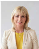
Ulrike Scharf, MdL Mitglied des Landtages und Bayerische Staatsministerin für Familie, Arbeit und Soziales