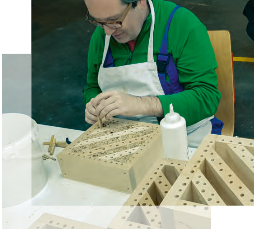
↑ Mitglied der MutMacherMenschen eG baut ein Wildbienenhotel

Die Genossenschaft bietet einen geschützten Rahmen, in dem sich die Mitarbeiterinnen und Mitarbeiter ohne äußeren Druck ausprobieren und die eigene Belastbarkeit testen können. Aber sie bietet auch einen Raum, um in einem arbeitstherapeutischen Ansatz wieder auf die üblichen Bedingungen am Arbeitsplatz vorzubereiten. So konnte ein bereits wegen seiner Erkrankung verrenteter junger Mann durch seine Arbeit bei den „MutMacherMenschen“ wieder so viel Selbstvertrauen und Belastbarkeit entwickeln, dass er aus der Rente zurück auf eine Vollzeitstelle in seinem erlernten Beruf wechseln konnte.