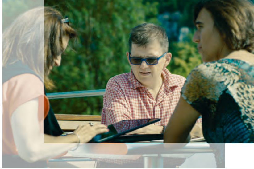
↑ Mitglieder der Werkstatt für Barrierefreiheit eG bei einer Team-Besprechung

Beides ist wichtig, um das Leitbild der inklusiven Gesellschaft, also einer Gesellschaft, in der Menschen mit Behinderung ganz selbstverständlich ein selbstbestimmtes Leben führen, zu verwirklichen.