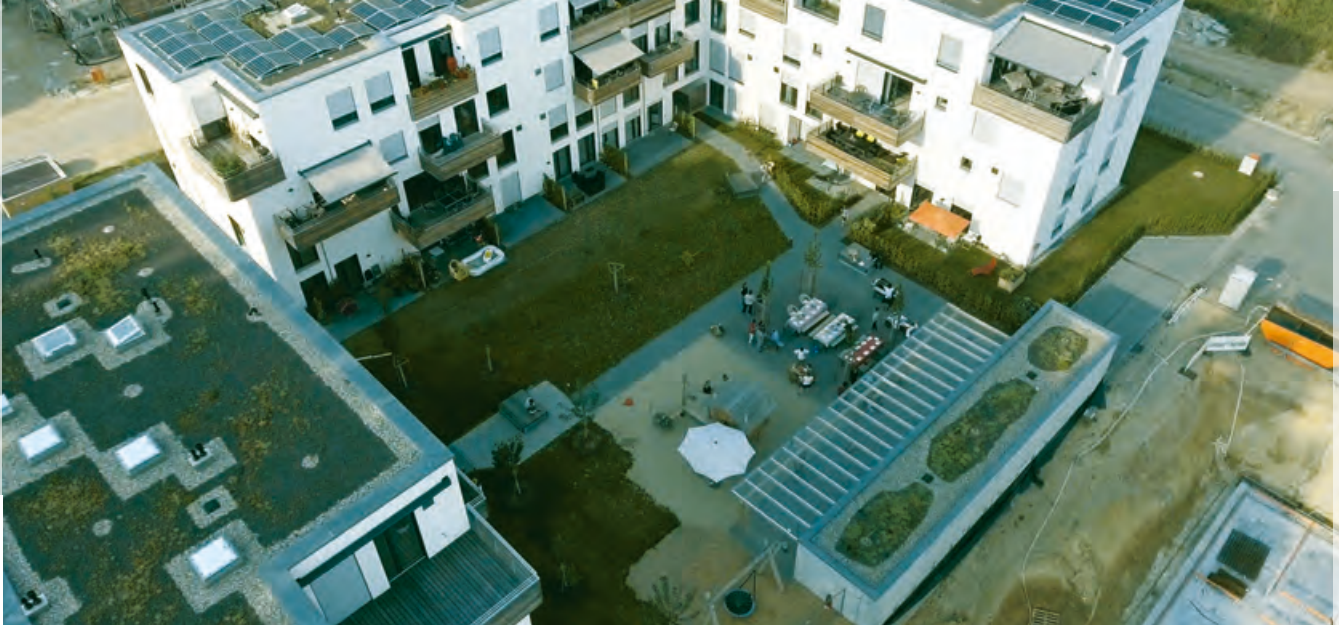
↑Wohnanlage der W.I.R. Wohnen Inklusiv Regensburg eG

nungen auf dem Areal der ehemaligen Nibelungenkaserne in Regensburg und unterstützen sich gegenseitig. Die Wohnanlage ist in mehrfacher Hinsicht beispielhaft. Die Bewohnerinnen und Bewohner mit Unterstützungsbedarf wohnen in eigenen Apartments, die zu Wohngruppen mit je sechs Einheiten („Cluster“) zusammengefasst sind. Diese Wohneinheiten sind den individuellen Bedürfnissen hinsichtlich Pflege und Betreuung optimal angepasst. Dabei ist durch den Apartmentcharakter mit eigenem Bad die Privatsphäre garantiert. Gleichzeitig bieten die beiden Cluster-Wohnungen spezielle Gemeinschaftsräume für gemeinsames Wohnen mit Freunden. So haben 12 geistig und mehrfach behinderte junge Menschen ein dauerhaftes Zuhause zum Wohlfühlen mit optimalen individuellen Unterstützungs- und Betreuungsmöglichkeiten gefunden. Auch den anderen Bewohnerinnen und Bewohnern der Anlage stehen mehrere große Gemeinschaftsräume als Treffpunkte und Begegnungsorte zur Verfügung. Der Gemeinschaftsgedanke hat in dieser Wohnanlage ganz allgemein einen hohen Stellenwert. Insgesamt konnte 40% der Wohnfläche als geförderter Wohnraum realisiert werden.