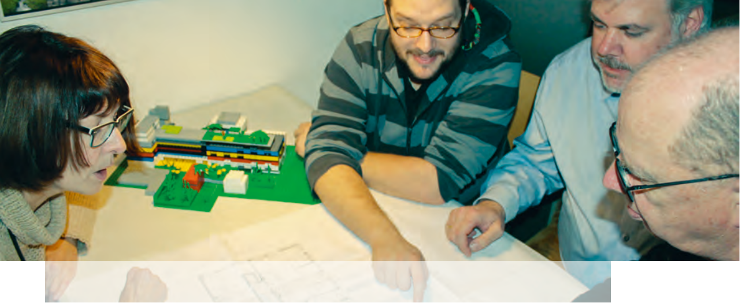
↑ Mitglieder der Spiegelfabrik Baugenossenschaft eG planen das Wohnprojekt

gemeinschaft für Studierende sowie vier Wohneinheiten für junge unbegleitete anerkannte Flüchtlinge geplant.