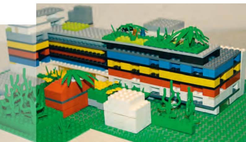
↓ Lego-Modell der „Spiegelfabrik“

Außerdem wird durch das sehr umfassende Wohn- und Quartierskonzept das angrenzende Stadtviertel sozial und gesellschaftlich miteinbezogen. Alle Bewohnerinnen und Bewohner, aber auch die Nachbarschaft sowie interessierte Bürgerinnen und Bürger sowie deren Ideen, Fähigkeiten und Bedürfnisse werden eingebunden. Die „Spiegelfabrik Baugenossenschaft eG“ wird zudem die Wohnanlage verwalten und sämtliche Aktivitäten und Nutzungen dauerhaft konzeptionell koordinieren. Auch ein Stadtteilquartiersbüro der Kommune mit einer sozialpädagogischen Teilzeitkraft soll in der „Spiegelfabrik“ angesiedelt werden. Das Konzept will zudem auch weitere Möglichkeiten für Kooperationen und Einbindungen der Stadt Fürth, sozialer Initiativen und sozialer Träger im Stadtteil aufzeigen.