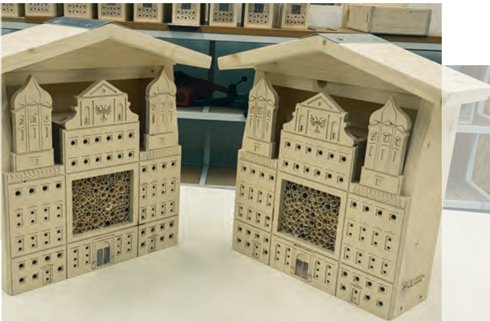
↓ Das Augsburger Rathaus für Wildbienen

Weitere Informationen über „MutMacherMenschen eG“ unter www.mutmachermenschen.de .