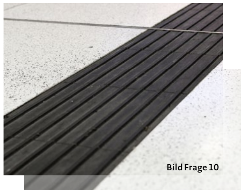
Bild Frage 10