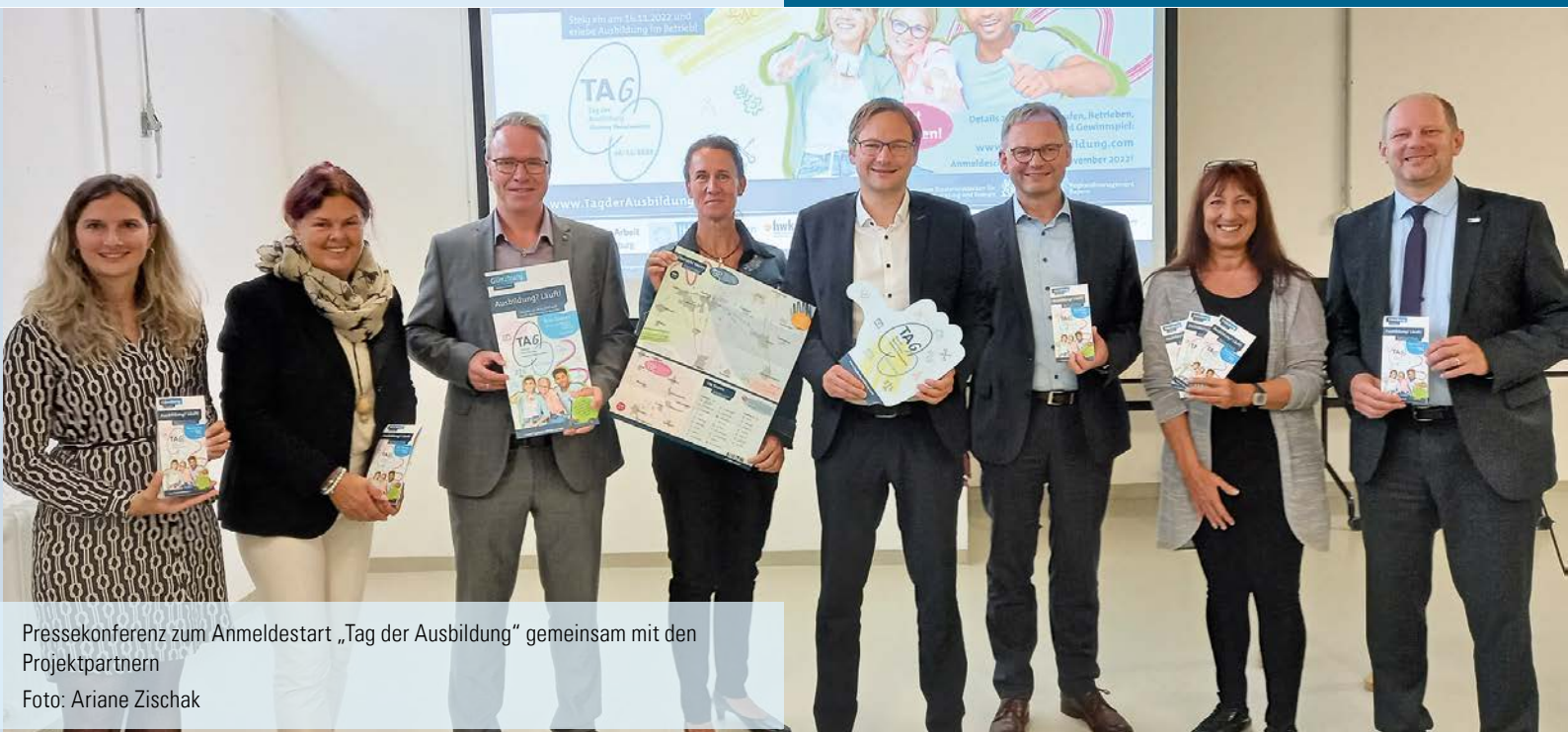
Pressekonferenz zum Anmeldestart „Tag der Ausbildung“ gemeinsam mit den Projektpartnern