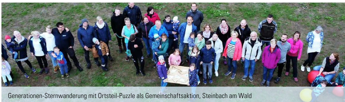
Generationen-Sternwanderung mit Ortsteil-Puzzle als Gemeinschaftsaktion, Steinbach am Wald