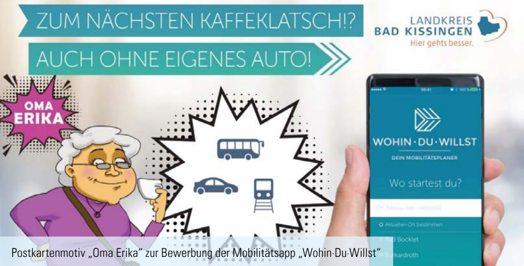
Postkartenmotiv „Oma Erika“ zur Bewerbung der Mobilitätsapp „Wohin-Du-Willst“