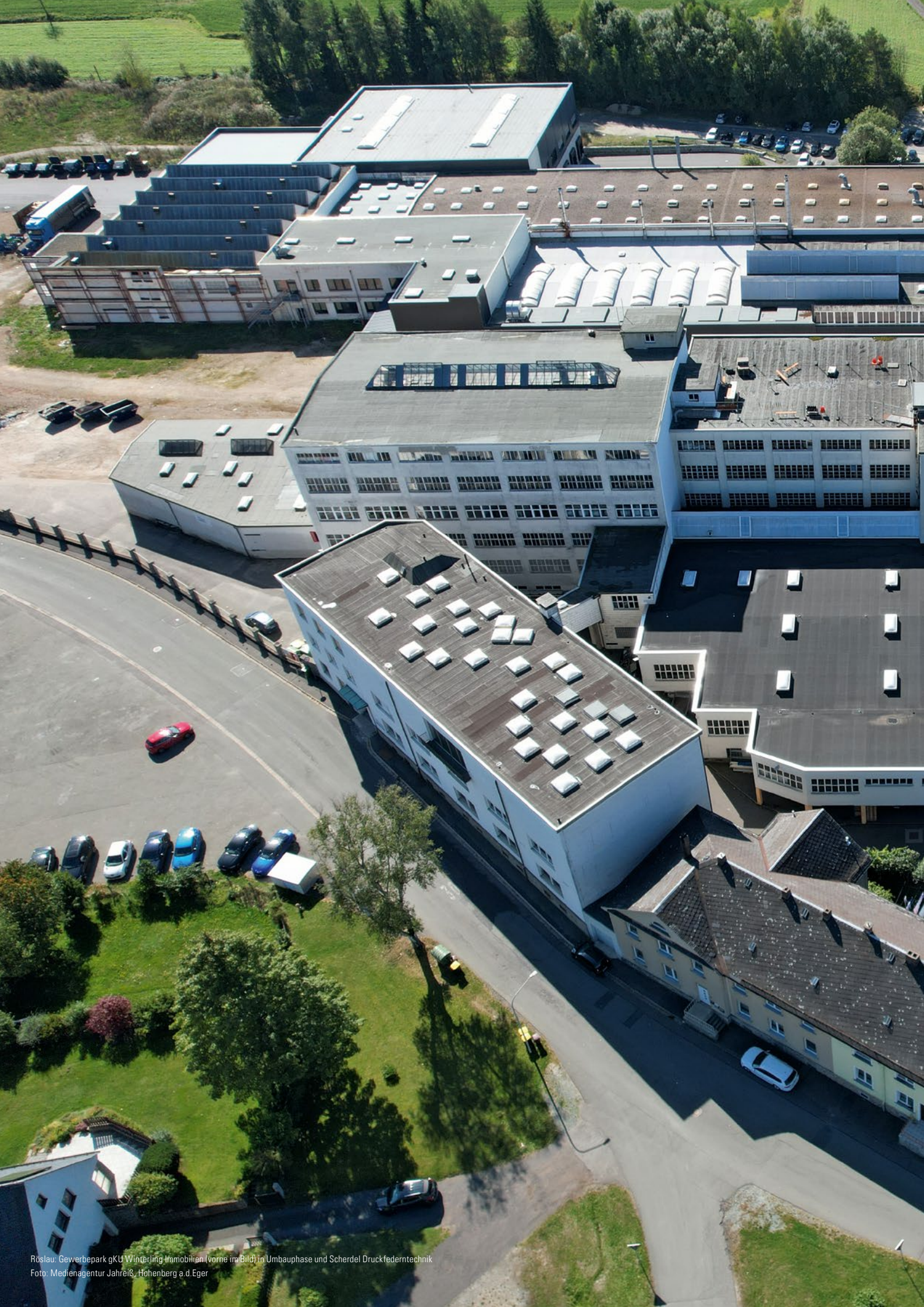
Röslau: Gewerbepark gGU Winterling Immobilien (vorne im Bild) in Umbauphase und Scherdel Druckfedertechnik