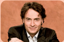
Giovanni di Lorenzo, Journalist und TV-Moderator, erinnert sich an seine Zeit als Schülerzeitungsredakteur.

Die Mitarbeit an der Schülerzeitung macht nicht nur Spaß, sie kann auch die ersten Weichen für eine spätere journalistische Karriere stellen. Ein Beispiel ist der Journalist Giovanni di Lorenzo. Er ist u. a. über Stationen beim Bayerischen Rundfunk, bei der Süddeutschen Zeitung und beim Tagespiegel zur Wochenzeitung DIE ZEIT gelangt, deren Chefredakteur er seit 2004 ist. Zudem moderiert er beim Norddeutschen Rundfunk die Talkshow „3 nach 9“.